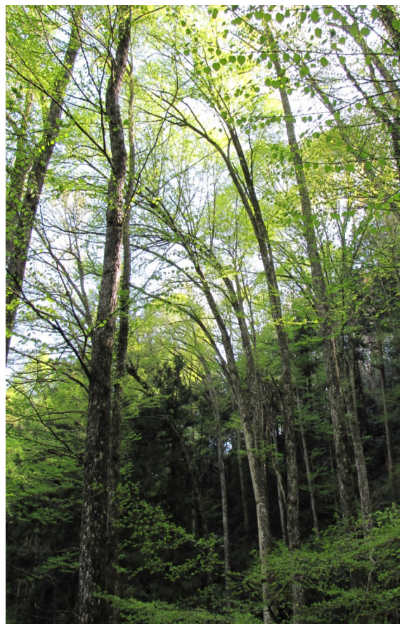
日影沢のカツラ林