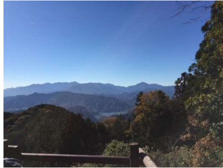
景信山からの丹沢の山並