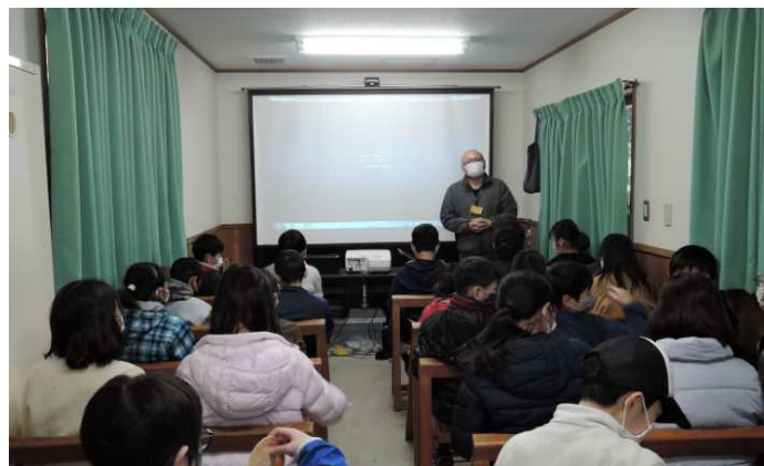
鋭い質問も飛びだした森林学習