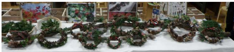
午前の部の皆さんの作品です

全員が無事に作業を終了した後、皆さんの作品を並べ「鑑賞会」。テーブルいっぱいに並んだリース達は想像以上に迫力がありました。そして全員で写真撮影を行って解散となりました。今年も参加者の家々はオンリーワンのリース達で彩られることでしょう。（磯）