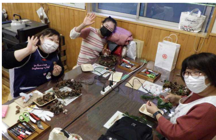
リース作り、楽しんでま〜す