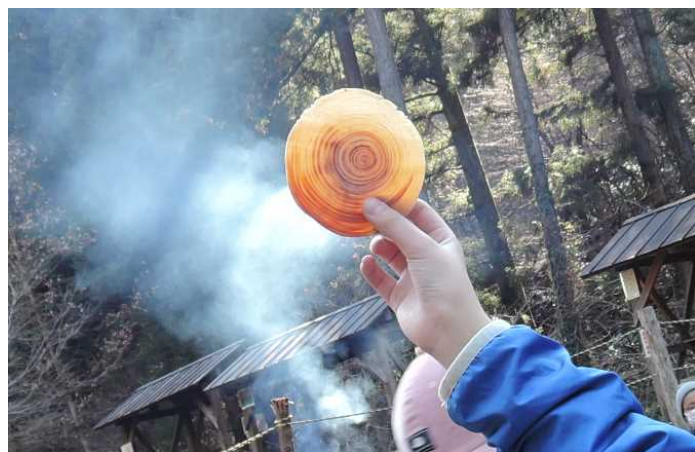
丸太を薄く切ったら透けてきれい！

今回もフォレストサポートスタッフの方々にご協力いただき無事終了となりました。（岩）