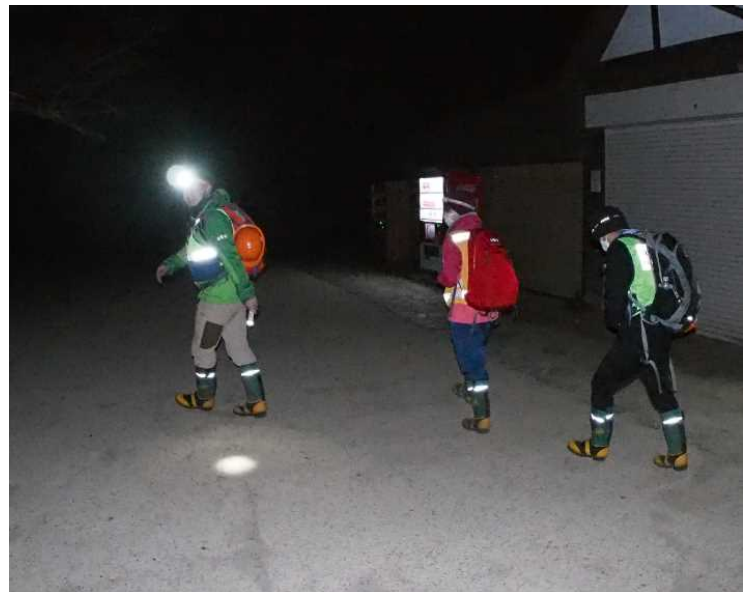
真っ暗闇の中、巡回出発！