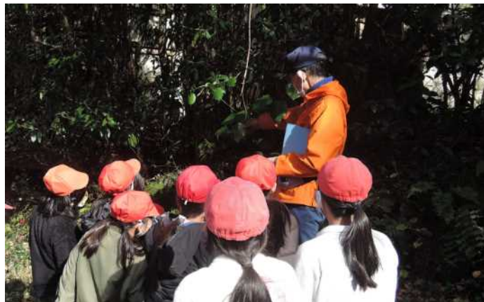
植物を熱心に観察

これから自分でもっと調べてみたい。」などの素晴らしい感想をいただきました。（高）