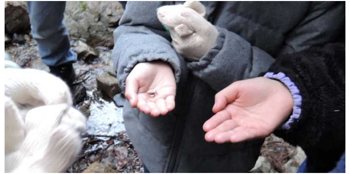
かわいい子ガニを見つけたよ！

使い方がわかった。丸太に触れて木の感触、木の優しさ、香りを感じる事ができた。木で作られた物を大切にしたいと思った」等、森林教室を通して色々なことを学んでくれたようです。（谷）