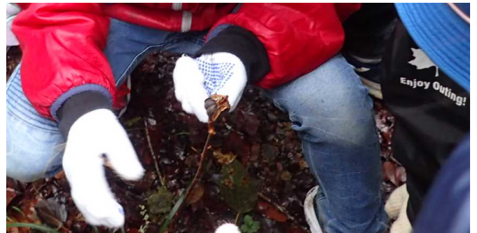
揺らすと種が出てきたぞ！