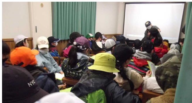
それって学校で事前学習しました！

閉校式では「今日はたくさんを知ることができてよかった。」「学校の周りとは違う自然いっぱい環境の中で学習できて楽しかった。」などの感想が出され、開校式での気合いのかけ声とおりの達成感を得られた様子でした。（枝）