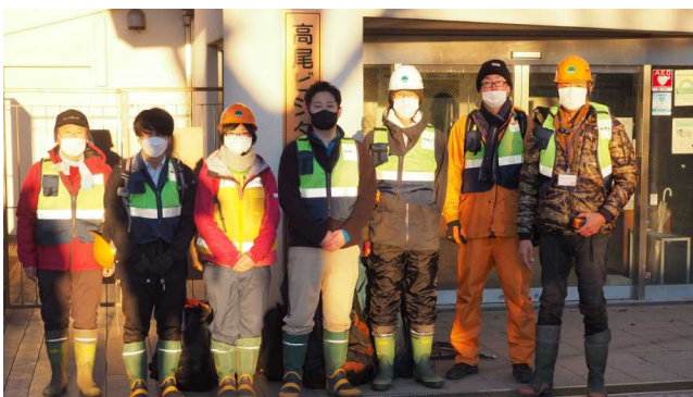
無事終了し御来光を浴びる参加メンバー

今年も高尾陣馬特別警戒連絡協議会の構成員として、東京神奈川森林管理署職員5名と当センター職員2名が山火事警防に参加。大晦日から元旦にかけて高尾山頂と小仏城山区間を交代で巡回。何事もなく無事終了しました。（高）