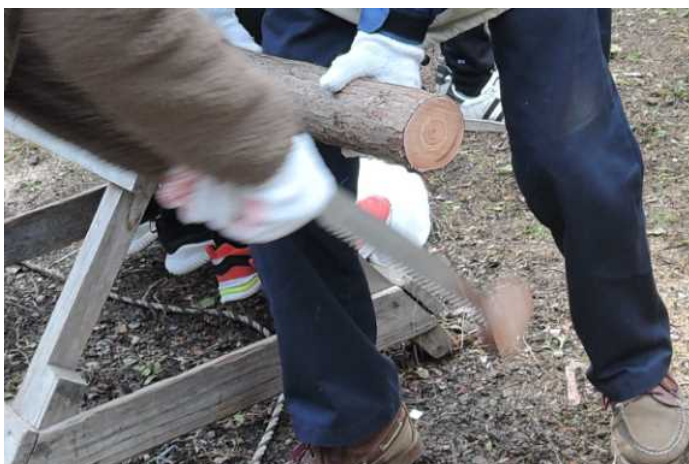
見事に切り落とし！