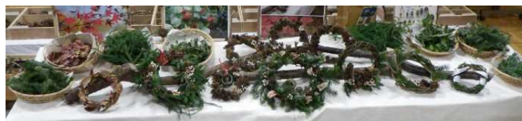
午後の部の皆さんの作品です