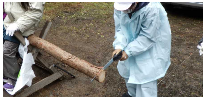
雨にも寒さにも負けず、ひたすら…