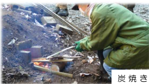
炭 焼 き