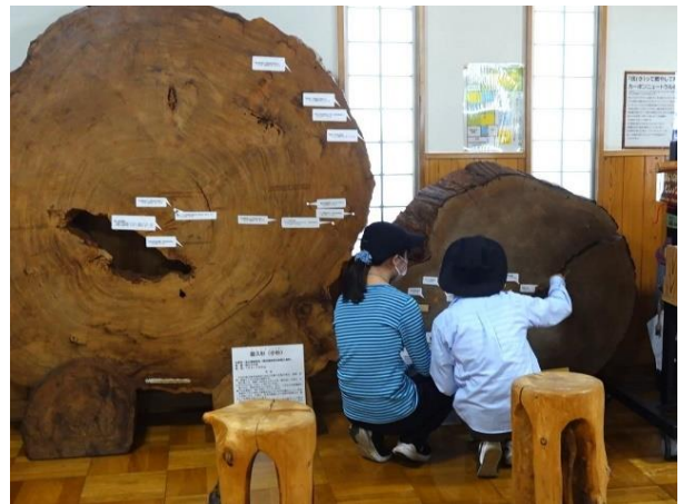
年輪を数えています（巨木の輪切り）