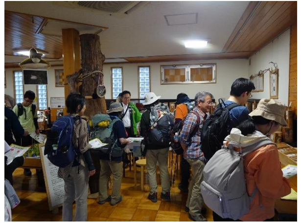
クイズラリーは盛況で順番待ち

5月9日と10日の2日間、林野庁等が主催する「みどりとふれあうフェスティバル」が、高尾599ミュージアム広場にて開催され、当センターもクイズラリー会場として利用されました。森林・林業に関する展示物を見学しながら木材の利用方法などを質問される方や、ゲームに熱中する親子連れ、木の実を使ったクラフトを体験される方々などで大盛況な2日間でした。