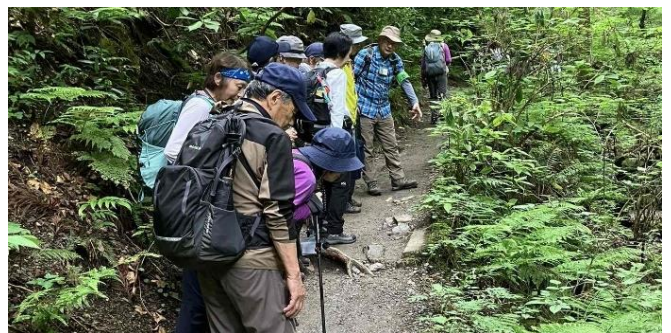
過去のイベント状況