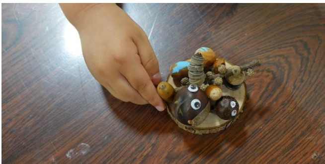
わたしもできた！（クラフト体験）