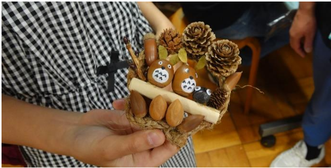
できたよ！（クラフト体験）