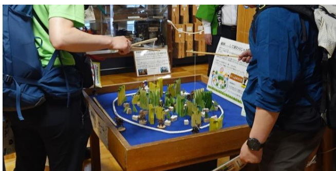
大人も夢中の「育林ゲーム」