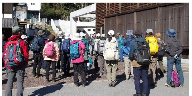
どのイベントも毎回盛況です