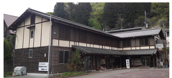
高尾森林ふれあい推進センター外観