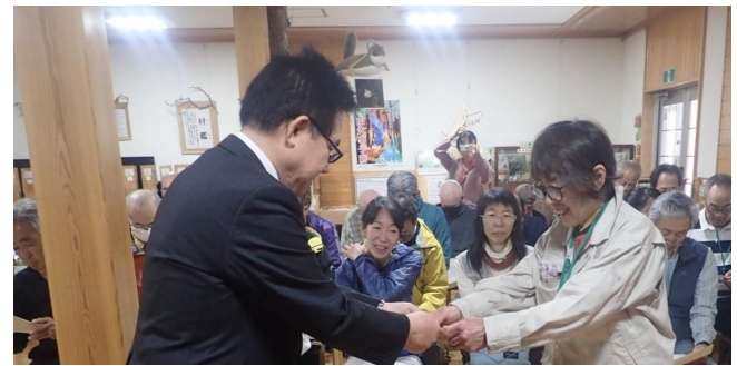
一人一人に委嘱証を交付