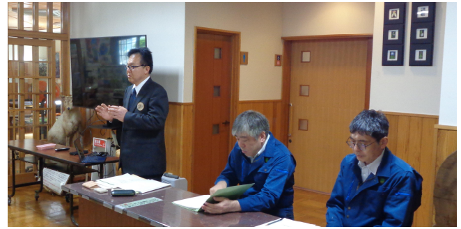
所長から委嘱に関する説明

4月18日（土）、センター庁舎においてフォレストサポートスタッフ（FSS）の委嘱証交付及び安全教育を実施しました。FSSは、関東森林管理局長から当センターが実施する森林環境教育や体験林業等のイベント業務に協力していただくスタッフとして委嘱を受けた方々です。一般公募により選定を行い、今年度は29名の方々がFSSとして委嘱されました。