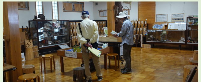
森林・林業に関する展示