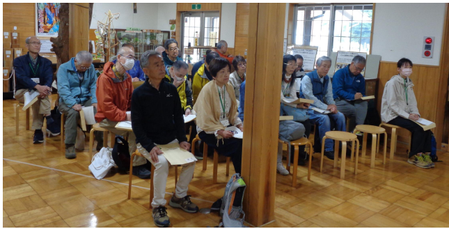
スタッフとして登録された皆さん