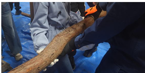
丸太の重さを体感