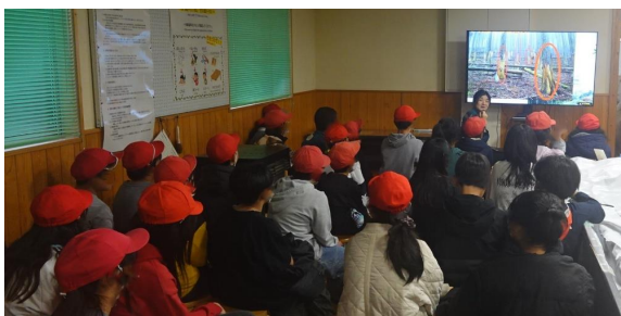
森林について学習