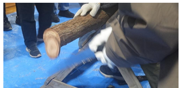
丸太切り (切れました!)