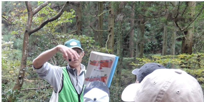
森林の働きを現地で観察