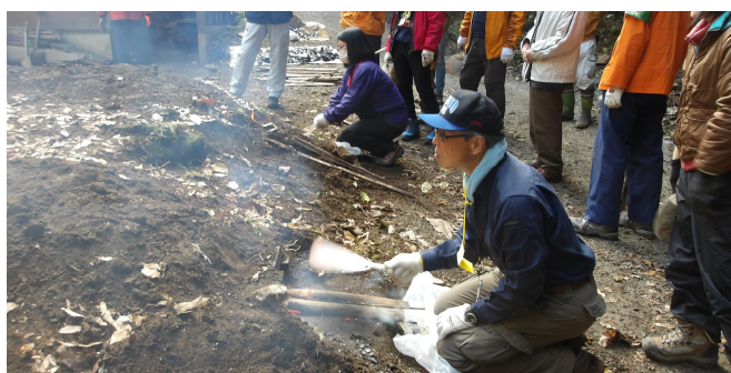
窯内に熱風を送り込む作業