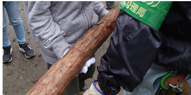
丸太切りの前に木の重さを体験