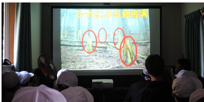
森林の働きを学習