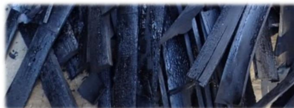
5年度のイベントで作成した竹炭