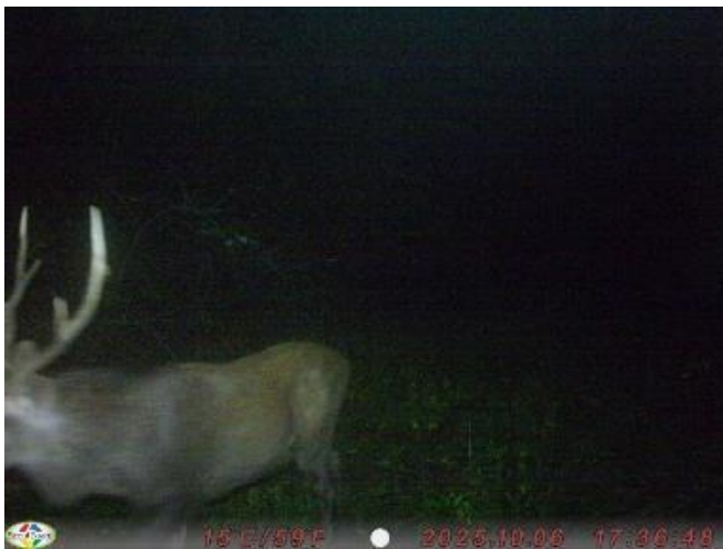
R7.10.6 太子町上野宮 オス