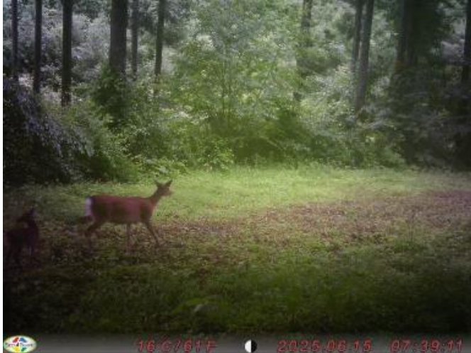
R7.6.15 （太子町上野宮） メス