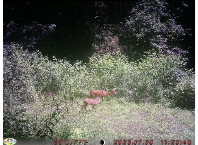
R7.7.30 太子町上野宮 メス、幼獣