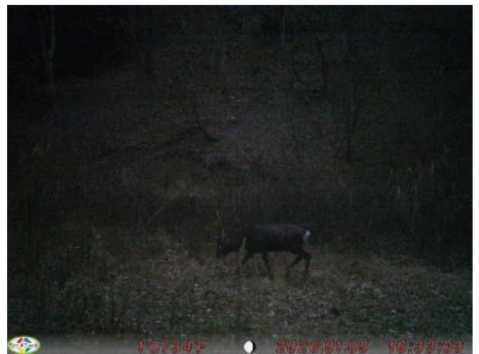
R8.1.5 太子町上野宮 オス