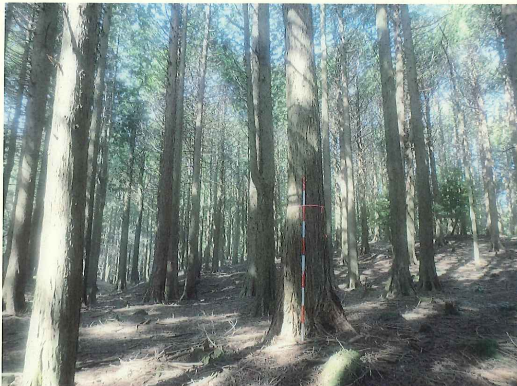
ヒノキの林況(林地中段)