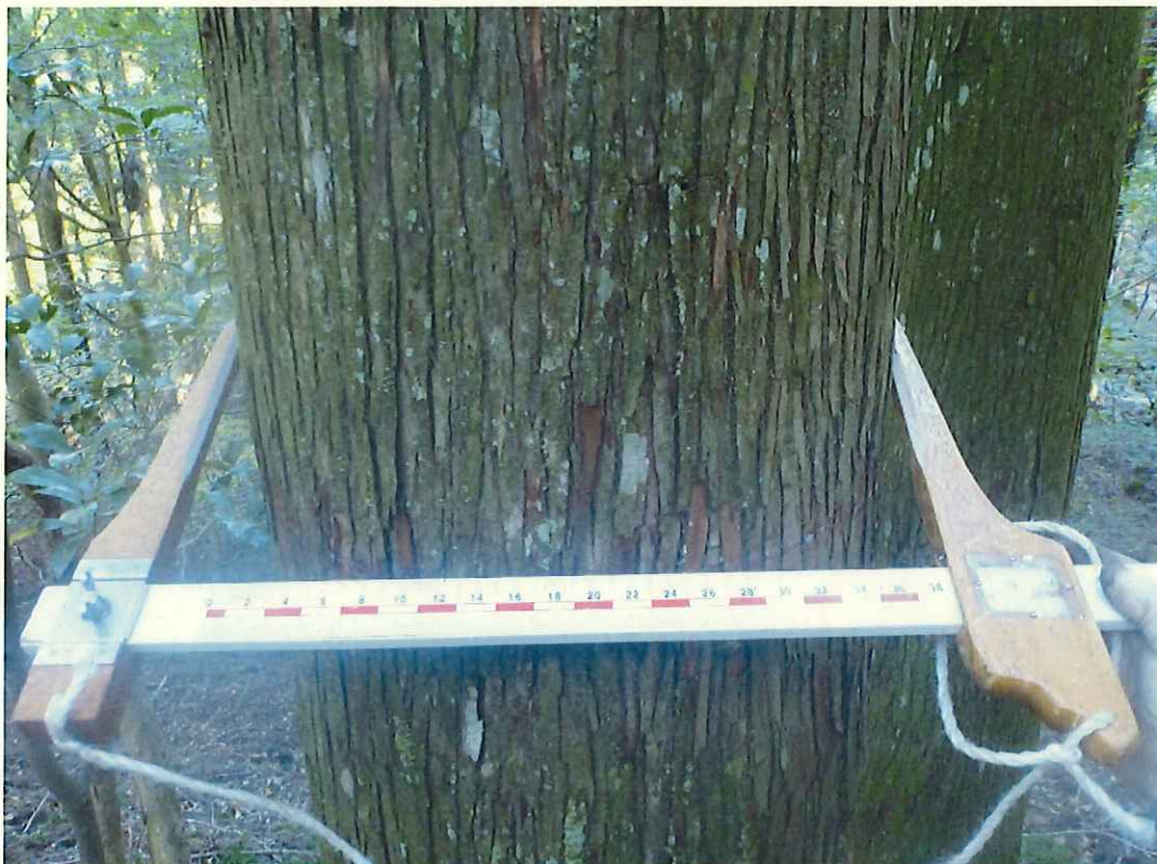
スギ分収木の生育状況