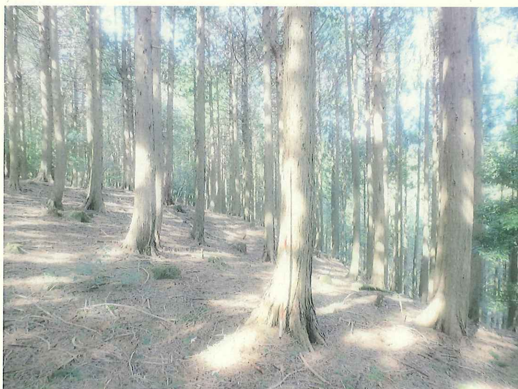
ヒノキの林況(林地上段)