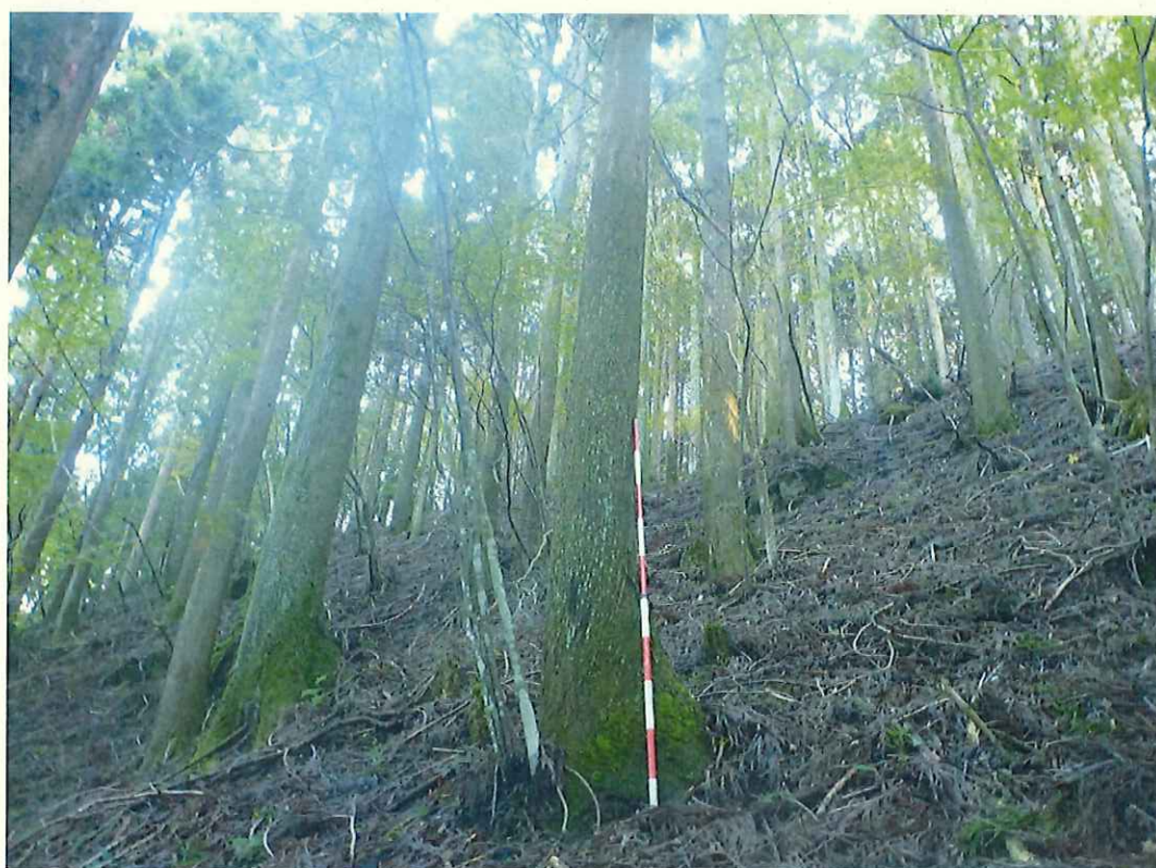
スギの林況(林地上段)