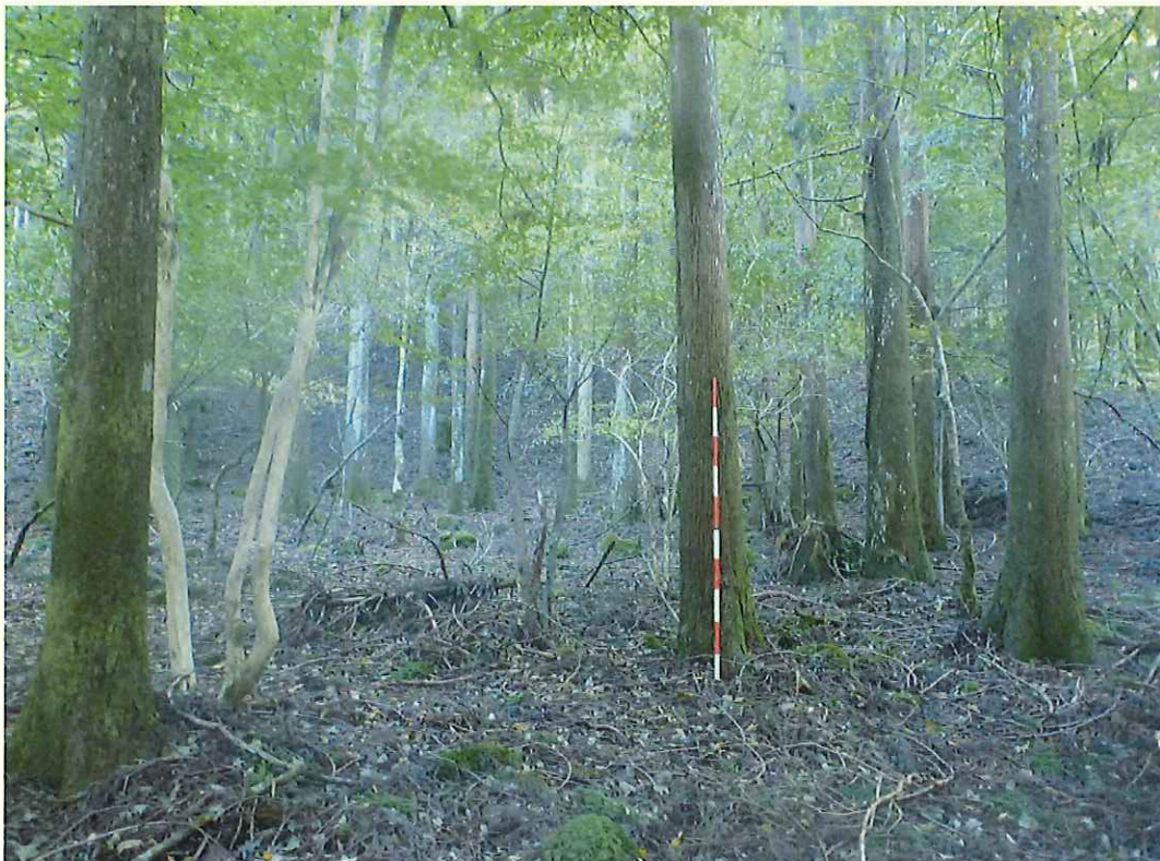
スギの林況(林地下段)