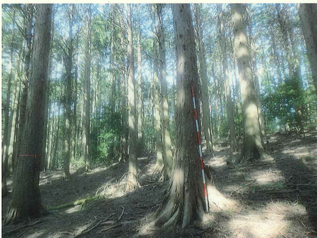
ヒノキの林況(林地下段)