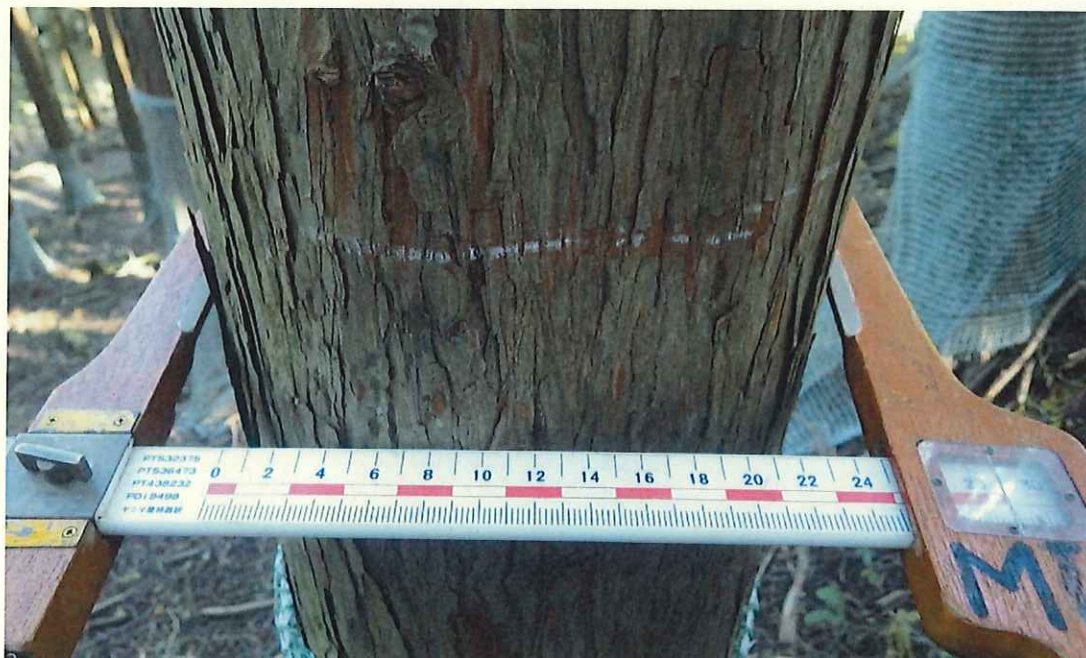
ヒノキ分収木の生育状況