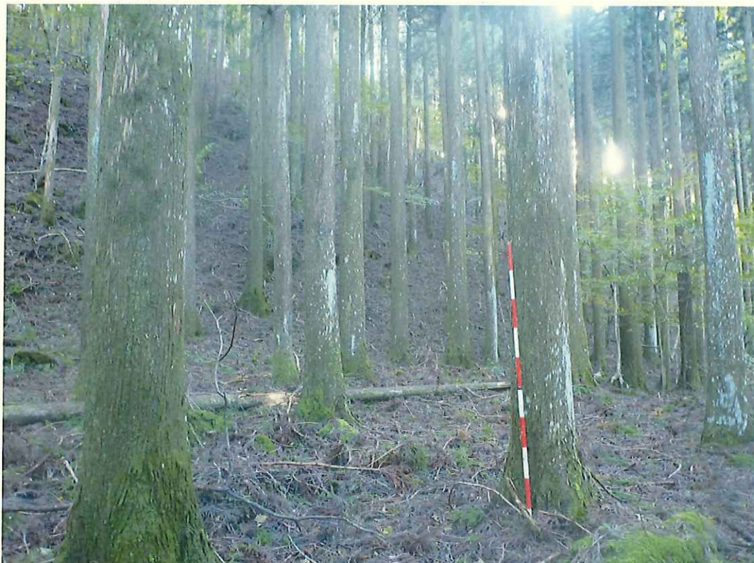
スギの林況(林地中段)