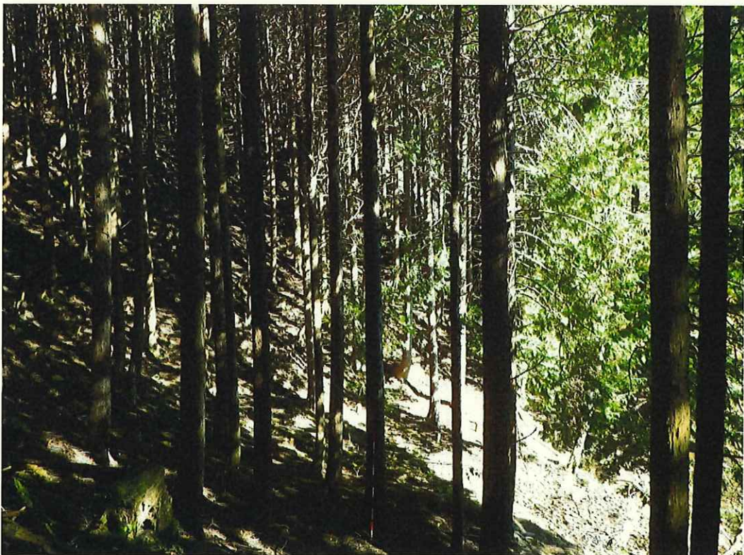
ヒノキの林況(林地地下段)