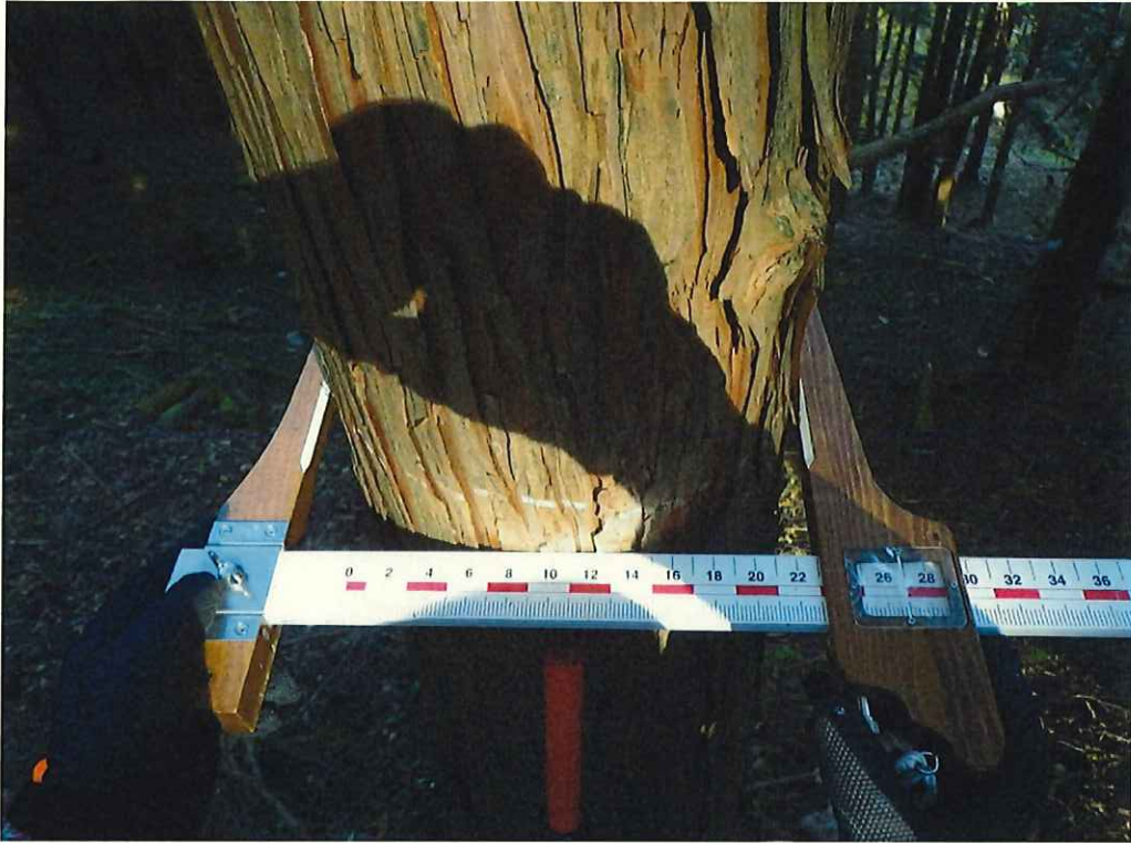
ヒノキの林況(林地上段)

所在地: 神奈川県足柄上群山北町世附 世附国有林104い4林小班 (旧 神奈川県足柄上群山北町世附 世附国有林104い1林小班)