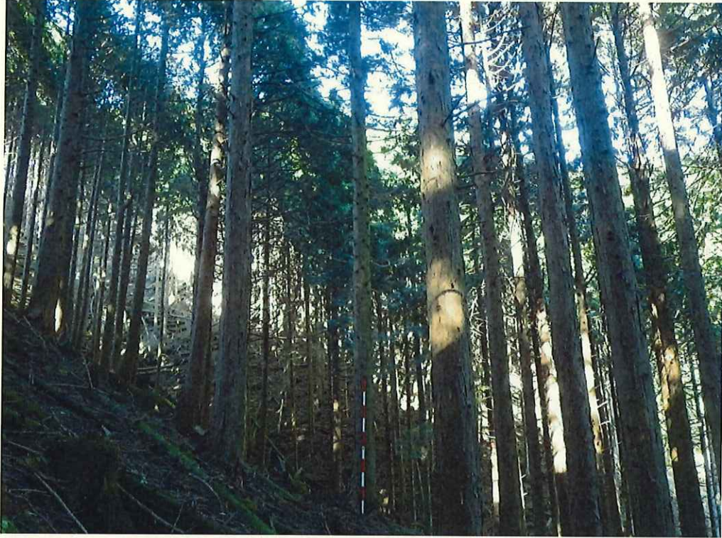
ヒノキの林況(林地中段)

所在地: 神奈川県足柄上郡山北町世附 世附国有林104い4林小班 (旧 神奈川県足柄上郡山北町世附 世附国有林104い1林小班)