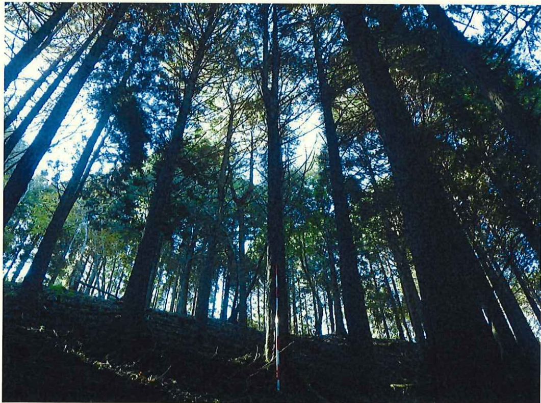
ヒノキの林況(林地上段)