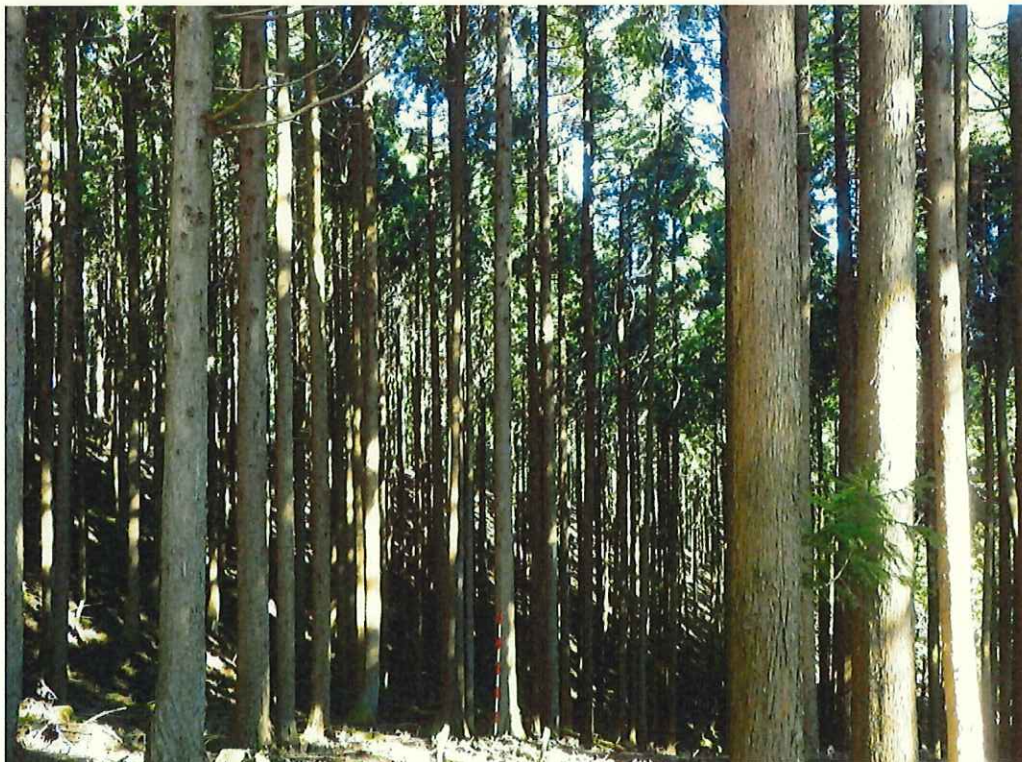
スギ林況(林地上段)