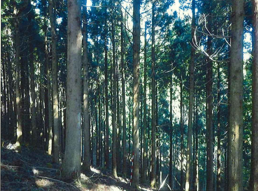
スギの林況(林地中段)

所在地: 神奈川県足柄上郡山北町世附 世附国有林104い4林小班 (旧 神奈川県足柄上郡山北町世附 世附国有林104い1林小班)