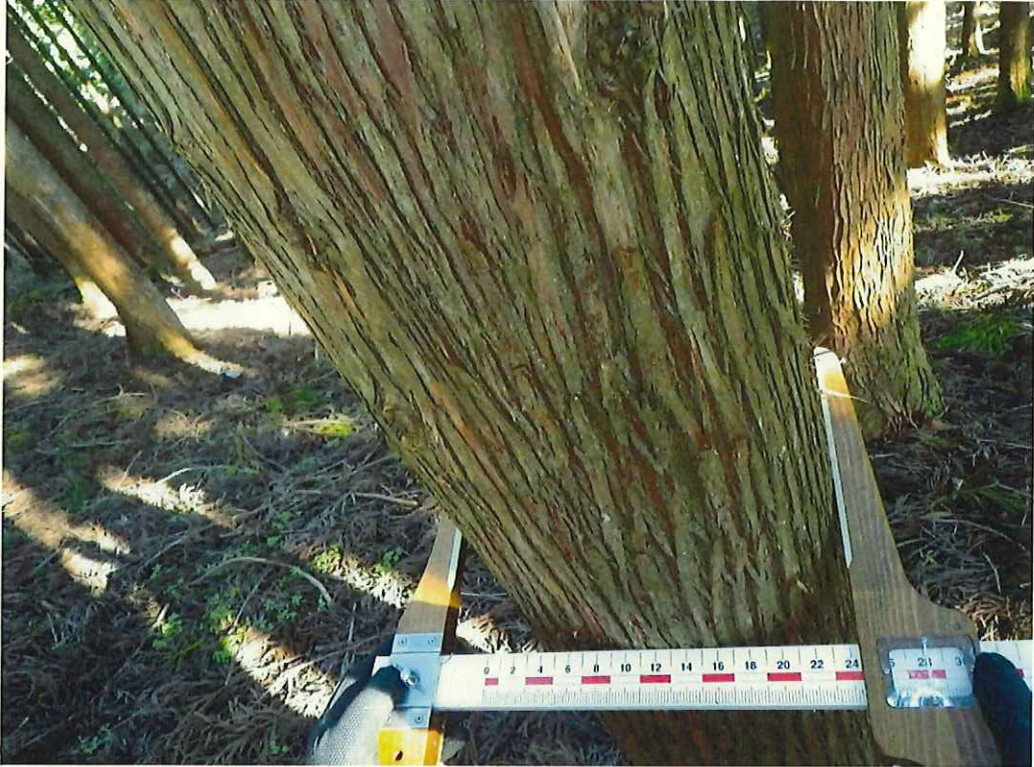
スギ林況(林地上段)

所在地: 神奈川県足柄上群山北町世附 世附国有林104い4林小班 (旧 神奈川県足柄上群山北町世附 世附国有林104い1林小班)