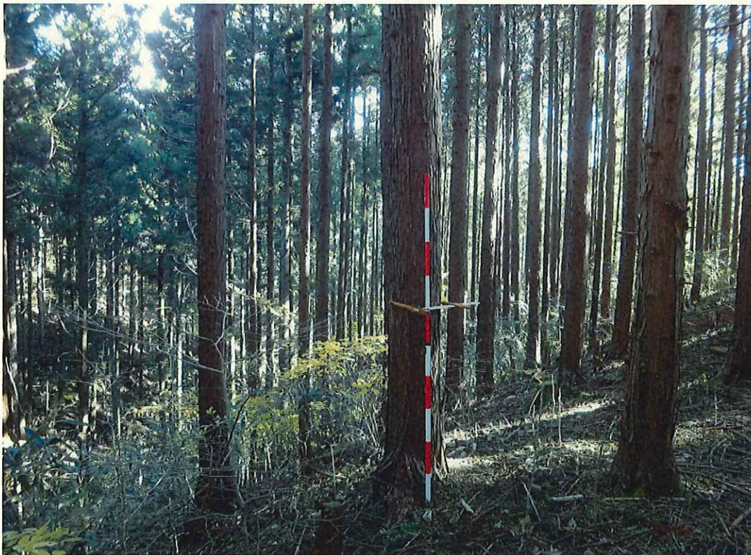
ヒノキの林況(下段)