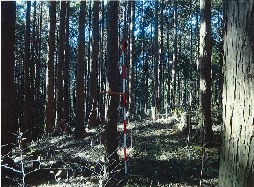
ヒノキの林況(上段)