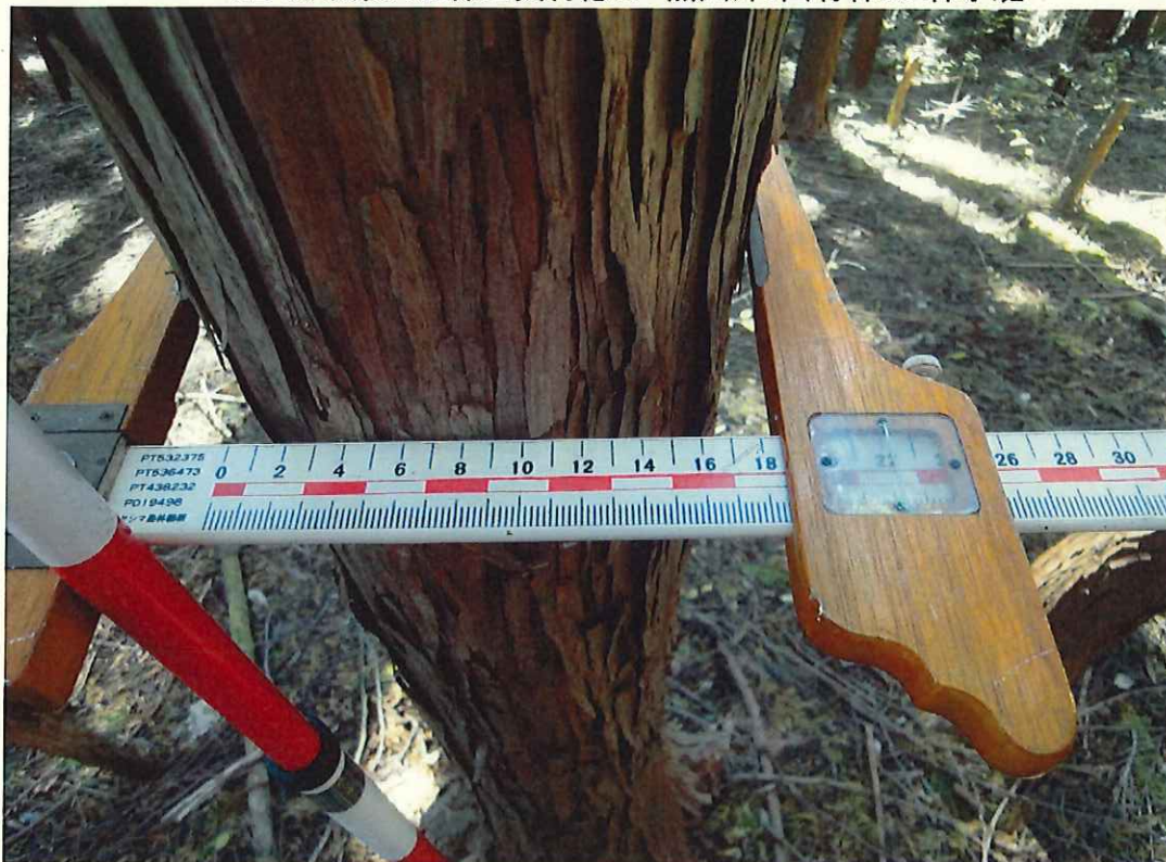
ヒノキの生育状況

所在地: 茨城県常陸太田市徳田町 茂塚国有林2003に2林小班 (旧 茨城県久慈郡里美村徳田 熊穴外1国有林3に林小班)