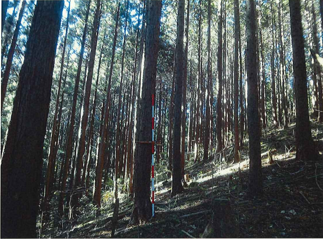
ヒノキの林況(中段)

所在地: 茨城県常陸太田市徳田町 茂塚国有林2003に2林小班 (旧 茨城県久慈郡里美村徳田 熊穴外1国有林3に林小班)