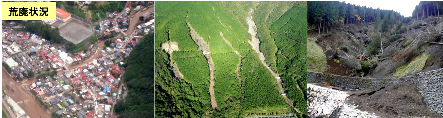
平成22年9月の台風第9号に伴う小山町内の様子