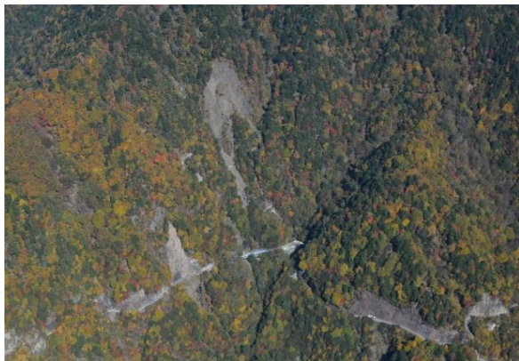
野呂川地区荒廃状況(コワシ崩)