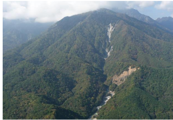
小武川湯沢地区荒廃状況