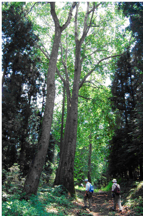
園内を散歩する入園者（スズカケの並木）