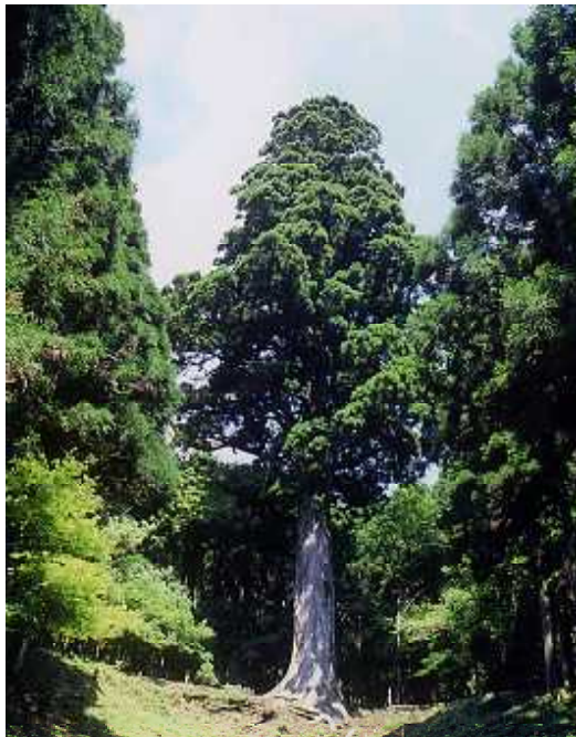
森の巨人百選「太郎杉」