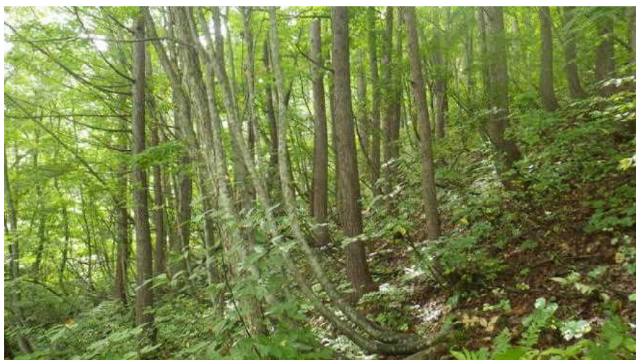
1号物件 2林班ろ小班

本物件は、持続的可能な森林経営が営まれ、伐採に当たって森林に関する法令に照らし手続きが適切になされた森林の立木である。