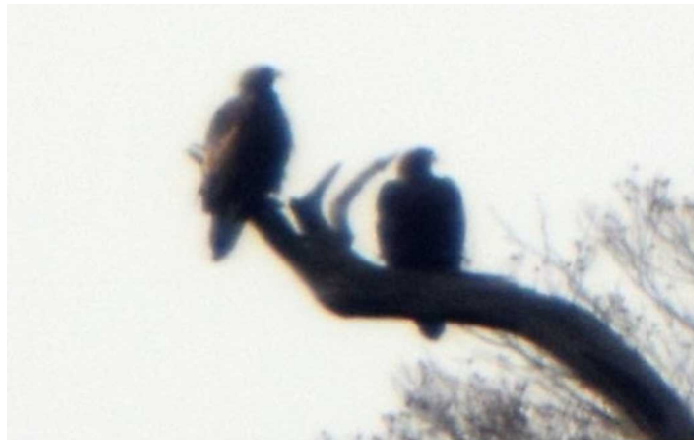
【伐採地を見渡せる場所で止まり獲物を探すイヌワシペア】 （撮影者：上田大志氏、撮影日：平成27年11月7日）

この試験の実施過程と成果を、絶滅の危機にある全国のイヌワシの生息環境の向上に役立てるため、多様な主体（林野庁職員、専門家、自然保護団体、地域住民、ボランティア、民間企業等）の連携により、モニタリングを実施していくとともに、そ