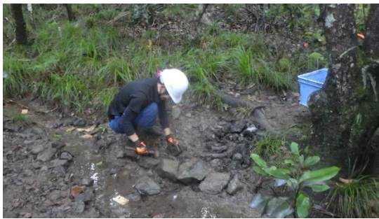
センター職員による歩道整備

また、指定ルートの維持管理も大きな課題です。指定ルートとは呼んでいますが、歩道ではなく、あくまでも森林内に立ち入ることのできる区域のことです。森林生態系保護地域の保存地区であることから、原則、人の手を加えないことが前提になります。一方で、森林生態系保護地域保全管理計画では、例外事項として実施可能な行為に「既設歩道等の維持修繕」がありますが、その取扱いを巡って利用者、専門家、センター職員の間で考え方が異なっていました。ようやく、平成30年度に、実施内容と対応の範囲等が明確化されました。現在は、センター職員のほか小笠原総合事務所国有林課とGSS（グリーン・サポート・スタッフ）の協力を得て、最低限の対応を行っているところです。