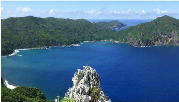
終点からの眺望（手前はラピエ）

母島の典型的な森林形態である湿性高木林で、ワダンノキ、ハハジマノボタン等が林内に多く、母島でしか見られない希少種が存在しています。また、固有陸産貝類（カタツムリ）の宝庫です。観光客のほか、調査や各種事業での行政関係者も多く入林します。原生的な自然を体験できますが、往復6時間程度かかる難ルートです。