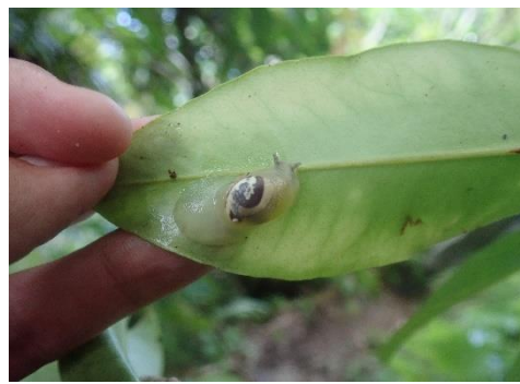
オカモノアラガイ