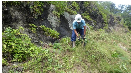
ルート周辺の外来種除去（国有林課の応援）

このほか、平成25年から、小笠原村役場において、近自然工法（駆除木や転石など、現地にあるものを活用し、現状に合わせて施工する方法）による改修を毎年実施していただいています。特に千尋岩ルートや石門ルートで、泥濘や段差等が適切に処理されてきたことについて大変感謝しております。