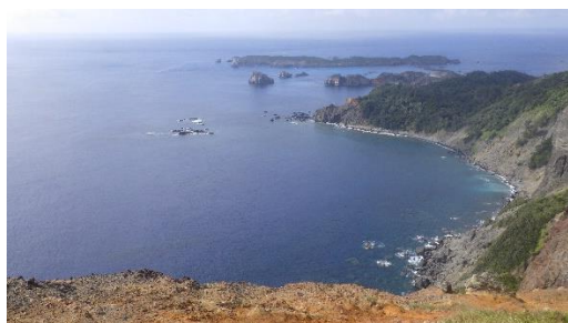
千尋岩ルート終点からの眺望（奥は南島）

小港海岸に近い北袋沢地区から衝立山を越えて千尋岩（通称：ハートロック）までの約4kmのルートで、終点からの眺望は絶景です。滝が見えたり、巨大なガジュマルの林を潜ったりと見所満載です。令和3年度は観光客の3割が訪れています。