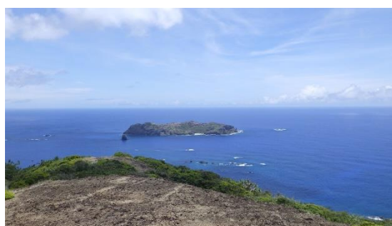
終点（初寝山）から望む東島