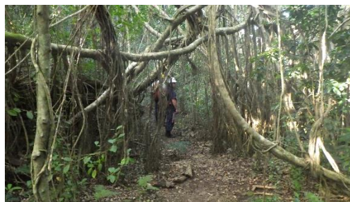
ガジュマル林のトンネル