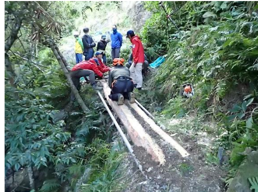
運搬した丸太を橋材に活用