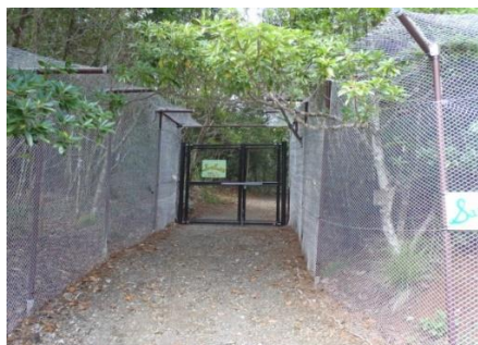
東平ルート入口（ルートは柵内）

アカガシラカラスバトの保全のため柵で囲まれたアカガシラカラスバトサンクチュアリー（28ha）内のルートです。アカガシラカラスバトの繁殖期（11～3月）には通行制限があります。乾性低木林の林内には、アサヒエビネ、ムニンノボタン等多くの希少種が生育しています。