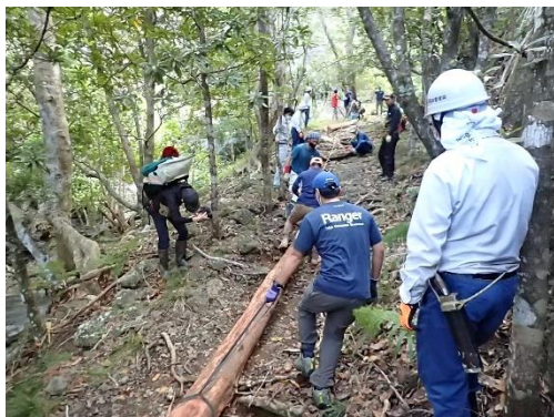
近自然工法（丸太運搬）

このほか、平成25年から、小笠原村役場において、近自然工法（駆除木や転石など、現地にあるものを活用し、現状に合わせて施工する方法）による改修を毎年実施していただいています。特に千尋岩ルートや石門ルートで、泥濘や段差等が適切に処理されてきたことについて大変感謝しております。