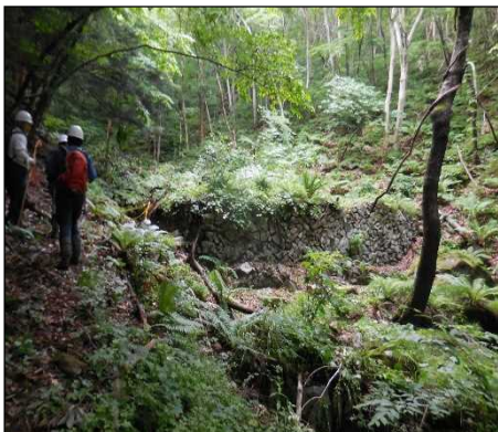
斜面下部からの施設全景

施設の老朽化を踏まえて、一定の制限を行いつつ案内看板を設置するなどして林業の歴史を伝えていく施設として管理していくこととしています。