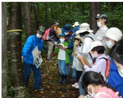
説明を受け熱心にメモ をとる子どもたち