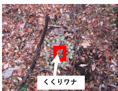
くくりワナを囲むようにエサを散布