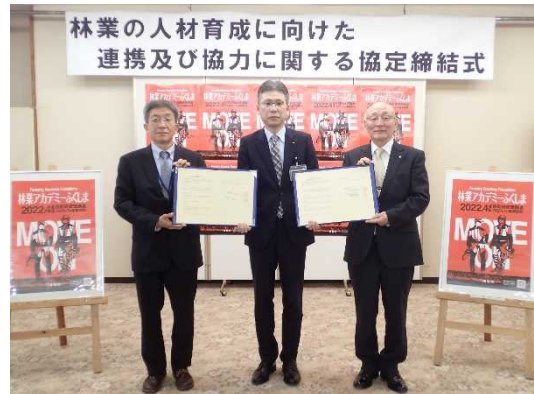
協定書を手にする（左から）福島森林管理署長、福島県農林水産部長、埴町長

福島森林管理署では、この協定に基づき実習フィールドの提供や、国有林野事業の木材生産の現場見学等を通じて、県内の森林・林業の担い手の育成に貢献していくこととしています。