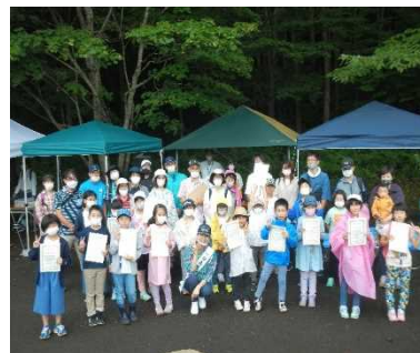
認定書を手に ハイポーズ