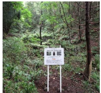
施設案内看板の設置