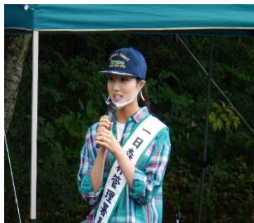
一日森林管理署長 「みどりの女神」

このイベントは、多くの市民に森林に親しんでもらうことを目的としていますが、もう一つ、若手職員が樹種名を覚えたり、教えることや伝えることの難しさを感じる機会ともなっています。市民との交流を通じた人材育成にも役立っていることから、今後も継続したいと考えています。