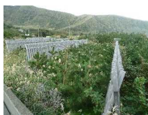
③⑩海岸林生育中（三宅島）

国民皆様の貴重な財産である国有林をいかに適切に管理経営していくか、日々奮闘しています。東京神奈川森林管理署が所属する関東森林管理局管内には30ほどの森林管理署等があります。木材生産・木材利用といった林業が盛んな地域の森林、自然災害への備えを重視する森林、水がめあるいは希少動植物が多く生息・生育し、生態系保全が重要課題の森林、登山家憧れの山々がある森林など、それぞれの地域の実情に応じて各森林管理署は様々な仕事をしています。