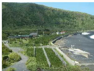
②⑨人家・道路を守る。

数少ない島嶼部の国有林です。面積はさほど広くありませんが台風の通り道です。人家近くの海岸防災林の造成などにより、住民の命・財産を守る取り組みを行っています（②⑨、③⑩）。