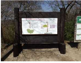
① 高尾山の森林とは