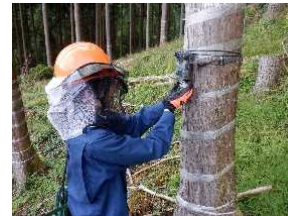
②⑤シカ・クマ動向把握