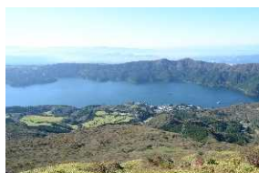
⑫ 芦ノ湖西岸国有林

箱根でも今年の台風被害は甚大でした。県道沿い斜面での復旧工事の幾つかは私どもが取り組んでいる治山工事です。また、森林の管理だけではなく、森林・林業に興味ある小学生などを対象に森林教室を開催しています。今年は新型コロナウイルス感染症の影響により未実施ですが、去年は箱根で開催しました (⑰)。