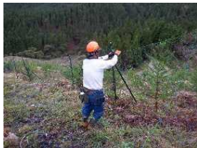
②③シカの餌にしない。