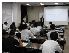
②⑧ネットワーク発会