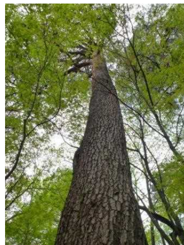
諏訪森のアカマツ

また、現在の諏訪森は、時代の変化によって林内の下草・枝葉・枯木が燃料や肥料として利用されなくなり土壌が肥えて、アカマツ以外の広葉樹などが繁茂し林内が暗くなっています。このままでは新たなアカマツの発芽・生育が困難で、諏訪森をアカマツ林として維持できません。このため、27年度に試験地を設定し、広葉樹や下草、腐葉土層等を除去して光環境や土壌を改善することで、アカマツの天然更新を促すことが可能かどうか調査しています。現在、試験地内には多数のアカマツ稚樹の発芽が確認されており、これらがちゃんと生育してくれるかどうかを見守っているところです。