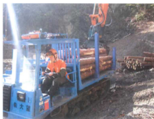
高性能林業機械を使用した丸太の伐り出し

本地域では、平成25年に山梨県峡南林務環境事務所と甲府水源林整備事務所、身延町森林組合、南部町森林組合並びに当所の5者で「身延・南部地域森林整備推進協定」を締結しています。同協定は、民有林と国有林が組織の垣根を越えて連携し、隣接するお互いの森林をより横断的・合理的な路網でつなぎ、分散している小規模な森林の団地