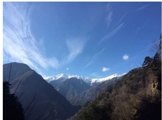
南アルプス林道から臨む北岳と間ノ岳

甲府盆地は、富士山をはじめ南アルプス山系、八ヶ岳、秩父山系、大菩薩嶺等の高く美しい山々に囲まれています。日本百名山のうち実に12座が山梨県にあり、長野県の30座に次いで2番目に多くなっています。山梨百名山というものも選定され、体力度と技術的難易度に応じたグレーディングがなされており、初心者でも自分のコンディションに合わせて登る山を選べる環境が整っています。