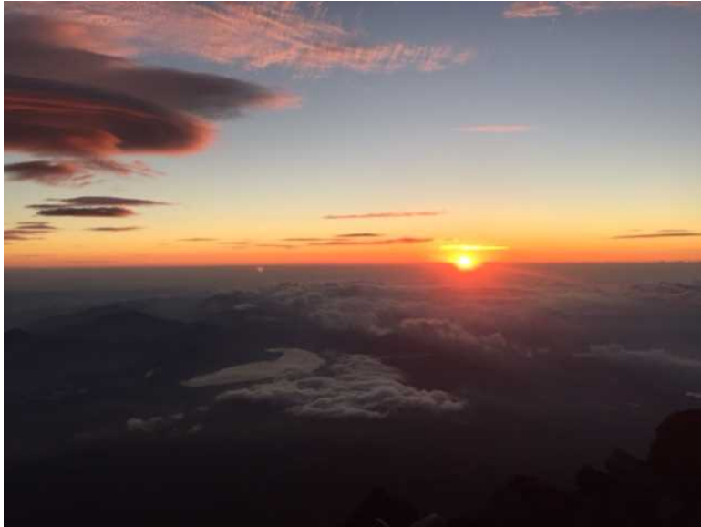
富士山頂から眺めるご来光と山中湖

北岳と間ノ岳は、2年目の夏に縦走しました。こちらは悪天候で視界が悪く、コースの難易度や時間もタイトでしたが、普段目にすることがない可憐な高山植物が咲くお花畑を眺めながらの登山は格別でした。北岳の山頂では、悪天候が幸いしてブロッケン妖怪に会うことができ、得がたい経験となりました。