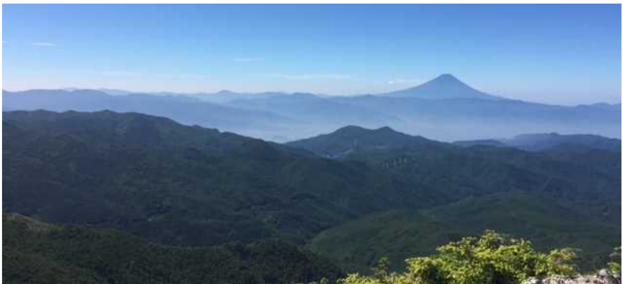
金峰山頂上から眺める富士山など広大な山々

このほかにも、甲府市最高峰の金峰山など幾つかの山に登りましたが、広大な山々を眺めながらいつも考えたのは、もしもこれらが恩賜林（県有林）やその他の民有林ではなく国有林であったら、山梨森林管理事務所の仕事のスケールも大きく変わっていただろうということです。