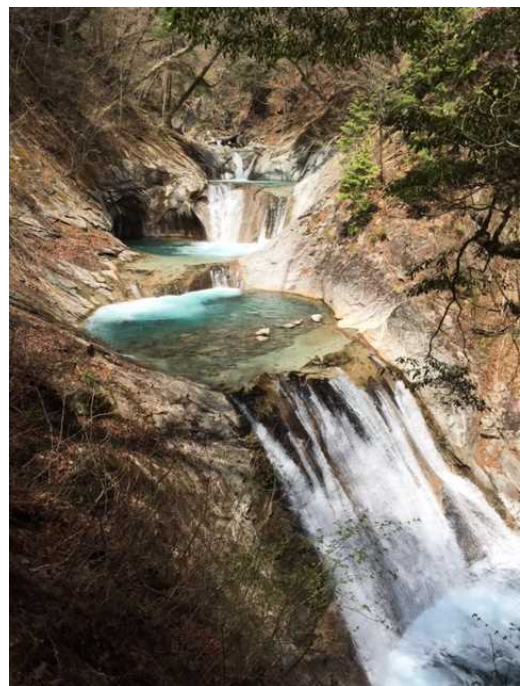
西山溪谷の七ツ釜五段の滝

山が多ければ森林も多く、県土面積に占める森林面積の割合は77.8%と、全国有数の高い森林率となっています。標高差が大きいこともあり、植生も実に多様です。また、これらの山々に面して、富士五湖や昇仙峡、清里、西山溪谷といった風光明媚な景勝地がいくつも存在しており、四季折々、場所それぞれに違った美しい風景が楽しめます。