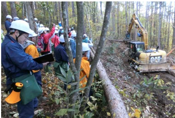
生産性向上現地検討会

管内の利用期を迎えた森林を活用するためにも、林業の成長産業化が地域の課題となっており、意欲と能力のある林業経営者の育成や林業生産性の向上を進める必要があります。このため、伐採搬出の生産性向上や下刈り作業省力化のための現地検討会を開催し、民有林も含めた地域課題の解決の一助となるよう取り組んでいるところです。