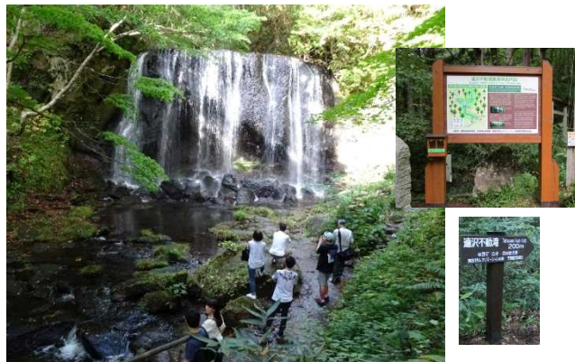
達沢不動滝風景林

山村地域の観光資源である自然豊かな森林を、レクリエーションの場として国民に利用いただくため、レクリエーションの森として指定されていますが、「日本の美しい森 お薦め国有林」に管内から5カ所が選定されており、多言語標識等の整備を実施しており、スキー等の野外スポーツに利用していただく取り組みも行っているところです。