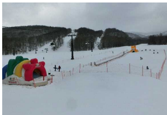
裏磐梯デコ平スポーツ林