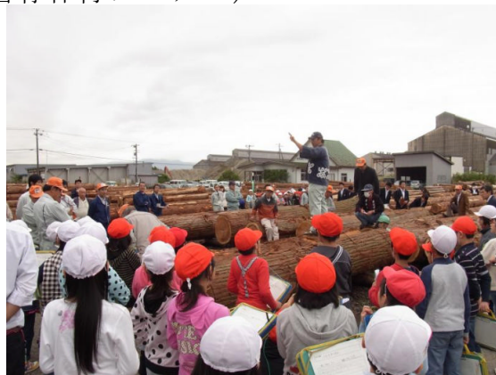
市場を見学している小学生