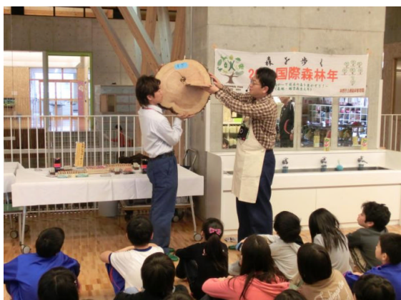
越後杉のPRと工作の説明