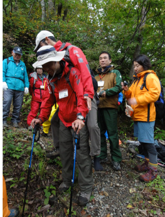
現地の安全対策の実技→