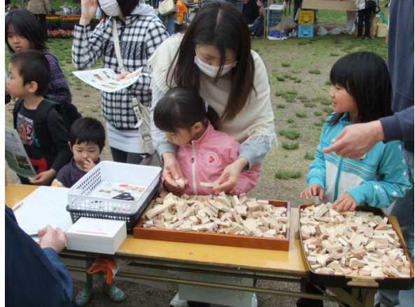
森のかけらストラップ作り