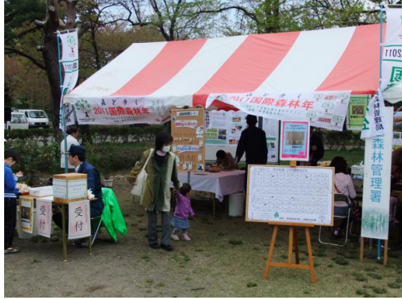
← 国際森林年の横断幕でP R する上越森林管理署ブース前