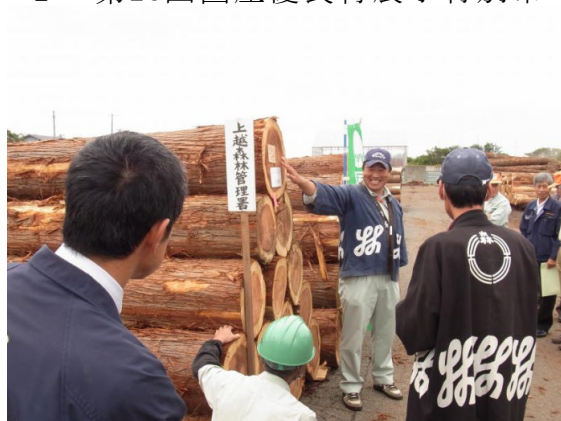
現場口ゼリによる販売の様子