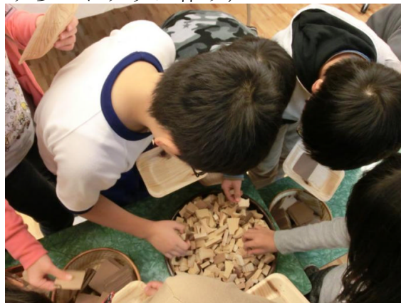
スギのかけらを選んでいきます。