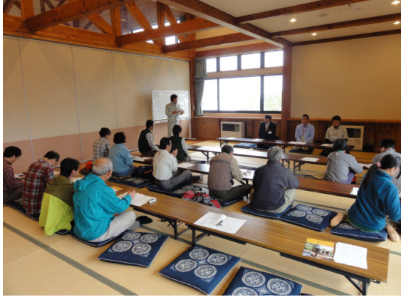
信越トレイルの歴史等の講義