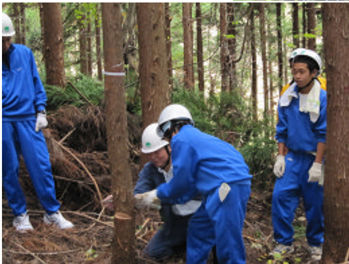
【体験林業：保育間伐】