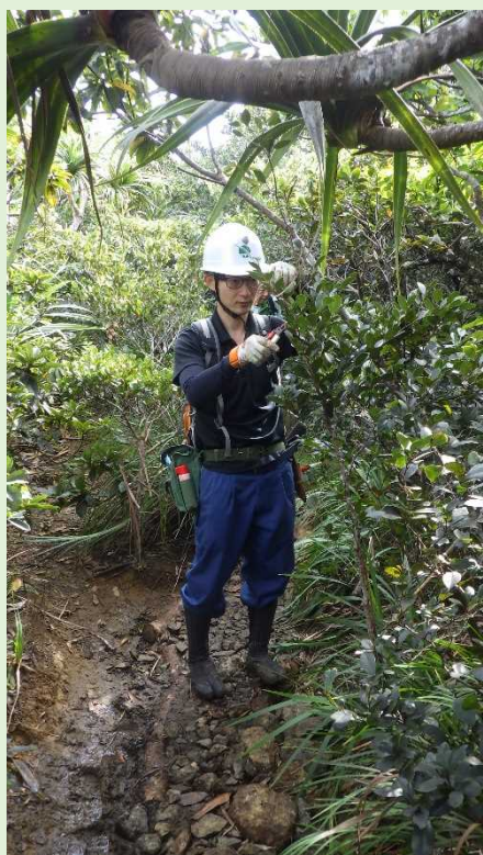
職員による剪定の様子