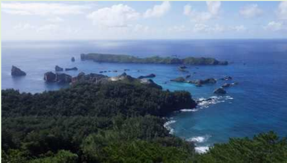
高山から南島方面を望む

父島ジョンビーチ方面の外来種の状況確認等のパトロールを行いました。 今回は小港から中山峠・高山を經由してジョンビーチへ向かいました。 南島方面の景色は素晴らしいですが、トクサバモクマオウ、リュウキュウマツ等の外来種が目立ちます。