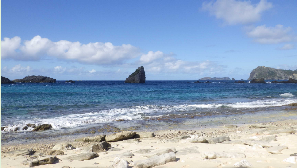
ジョンビーチからの眺め

ジョンビーチに到着。このビーチと隣のジニービーチは父島の中でもきれいなビーチですね。少し沖に出ると潮流があるので、遊泳には注意が必要です。カヤックで訪れる方が多いようです。