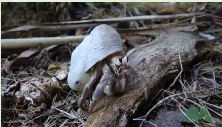
ヒロベソカタマイマイに入ったムラサキオカヤドカリ

ジョンビーチへ向かう途中、1000年から2000年前に絶滅したとされるヒロベソカタマイマイ（半化石）に入ったムラサキオカヤドカリを発見しました。天然記念物の貝の中に天然記念物のヤドカリが入っているのは、南島ではよく見かけますが、父島ではレアですね。