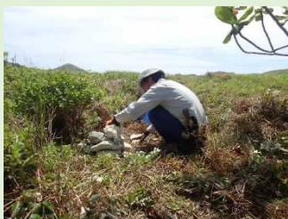
道標のケルンを設置、これでわかるかなあ？