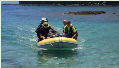
上陸は小型のボートで

聾島は父島の北約70kmにある無人島で、定期船はなくチャーター船等では行くことができません。片道約3時間かかることから、頻繁に行くことはできませんので、行ったときに一度に色々な仕事をを行います。今回は、6月に小笠原村が主催する聾島見学会に備え、ルートの明確化、オガサワラスナハキバチ生息地の保全を行いました。