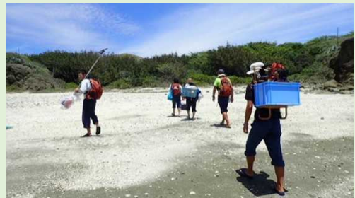
いざ、上陸（この浜にはオガサワラスナハキバチが生息しているので、通行には注意願います）