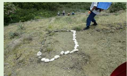
スナハキバチの営巣地を石で囲いました。踏み荒らさないよう気をつけましょう。