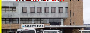
みなかみ町役場(後閑駅そば)