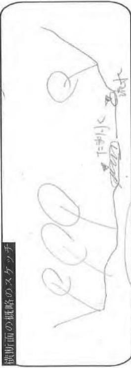
横断面の概略のスケッチ