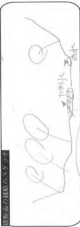
上流を向いての断面図・下流を向いての断面図

*: 融雪時や豪雨時に水に浸かる部分で、基本的に植生のない範囲 ○ 横断形状: 峡谷(谷斜面が迫る) <- 中間 -> 広い河原