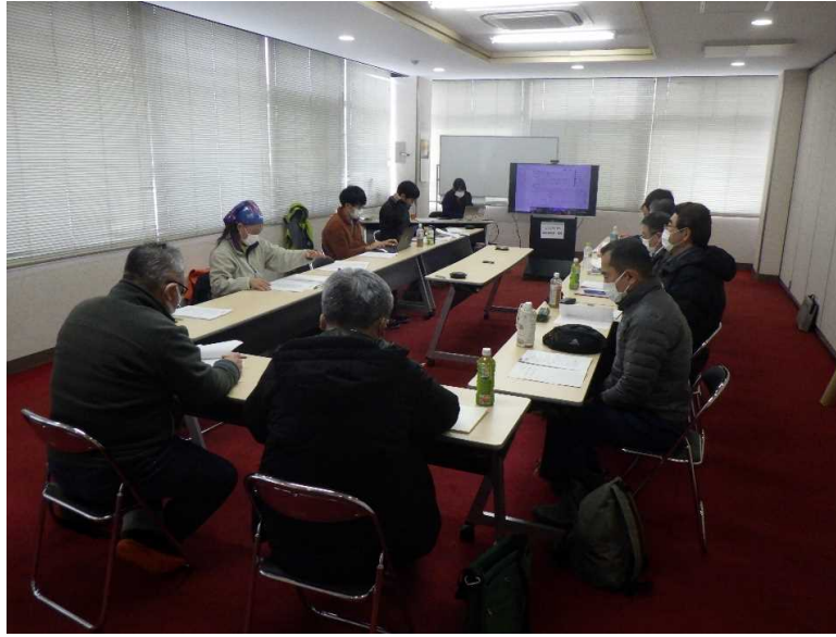
赤谷プロジェクト-みなかみ町連携会議