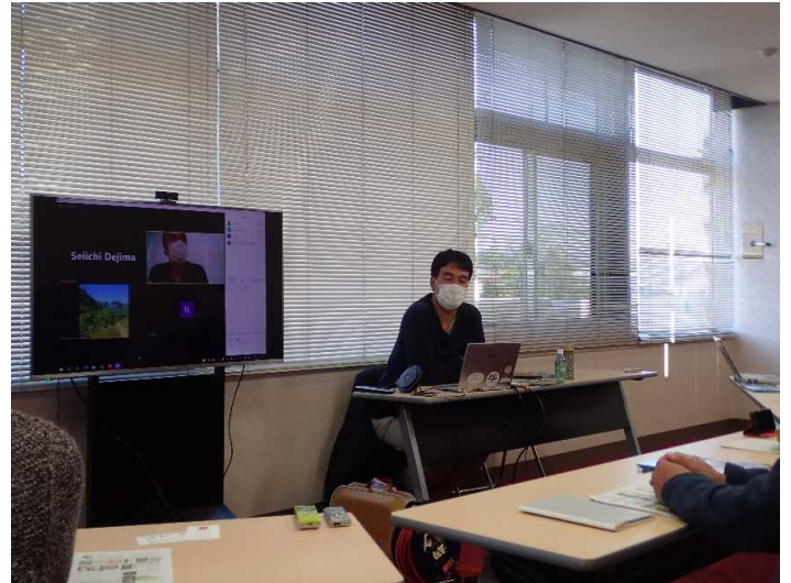
第2回溪流環境復元WG