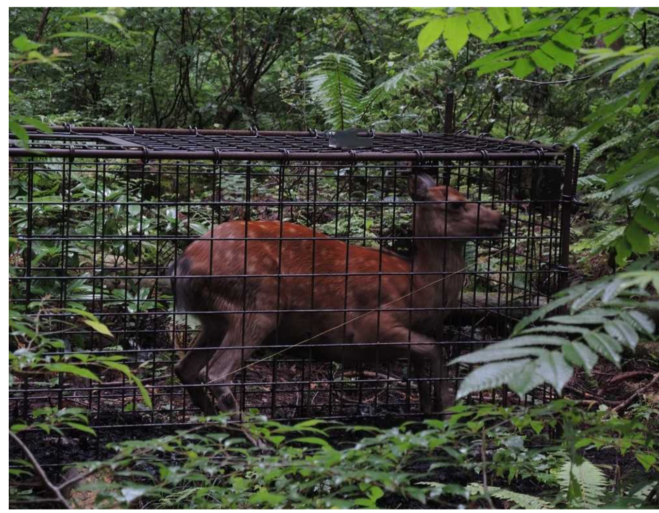
（写真2）箱罠で捕獲したニホンジカ