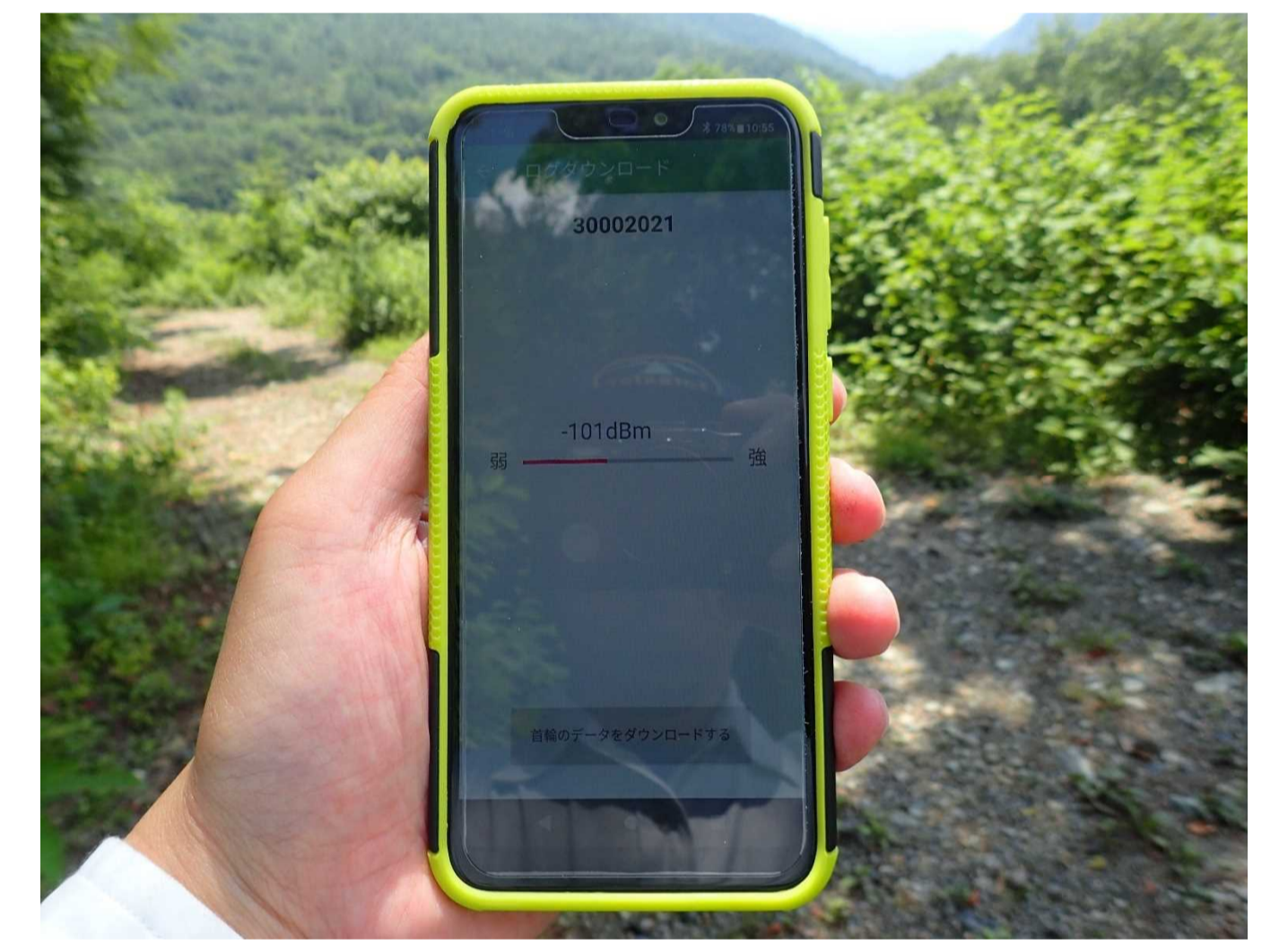
（写真5）データのダウンロード