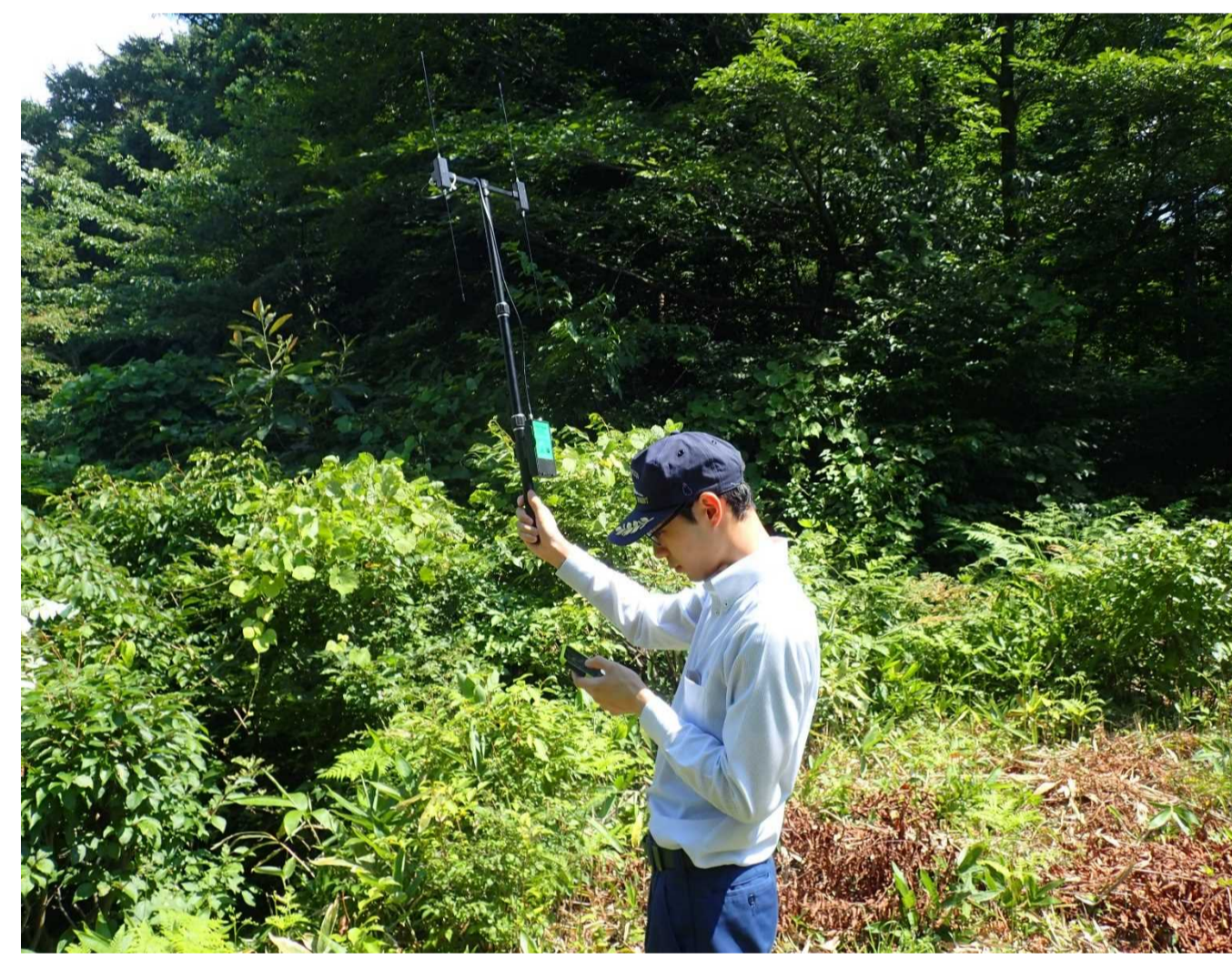
（写真4）追跡調査の様子