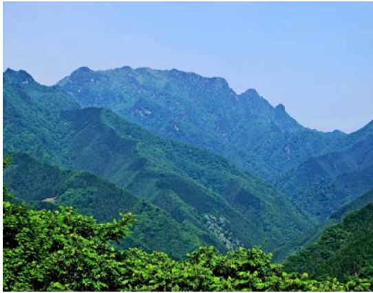
小鹿野町から両神山

両神山(標高1,723㍍)は、埼玉県の西部、秩父市と秩父郡小鹿野町の境目にあり、奥秩父山塊の北端に位置し秩父多摩甲斐国立公園に属しています。山頂付近は硬いチャートで形成され鋸歯状の岩稜の山です。