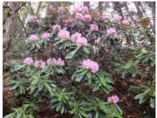
両神山のシャクナゲ