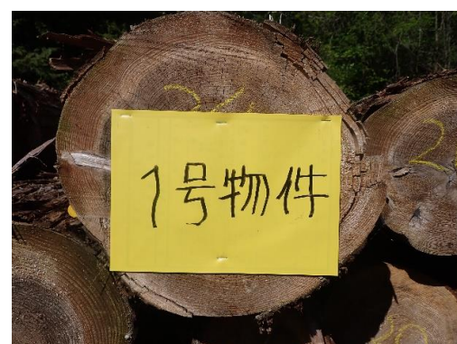
集積番号8-1 : 2.0m及び4.0m材