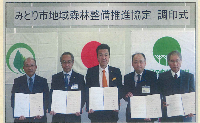
桐生広域組合代表理事 みどり市長 わたらせ森林組合代表理事 県桐生森林事務所長 群馬森林管理署長