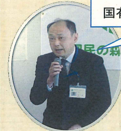
群馬森林管理署長あいさつ