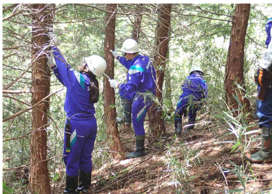
体験林業を行う倉淵中学校の生徒さん

結んだ団体等が行う森林整備活動への技術支援を行っています。また、森林環境教育の一環として、高崎市の倉淵中学校においても森林教室を開催してきており、今年度も教室での座学とあわせて、森林内での枝打ち作業を体験してもらおうことができました。