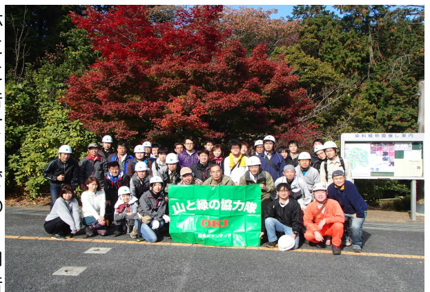
ボランティア団体

編集所 F T 行 A E 集 X L 所 (00) 総 (22) 関 (77) 東 ( ) 森 22 林 31 管 00 理 ・ 局 11 課 31 局 95 38