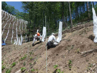
シカ単木保護状況 (鍋割国有林43林班)

行い、その後に植付けという工程にならざるを得ません。これも自然環境の変化による造林作業種の追加ということなのでしょう。時代にあった森林施業を着実に実施していく以外に方法はありません。