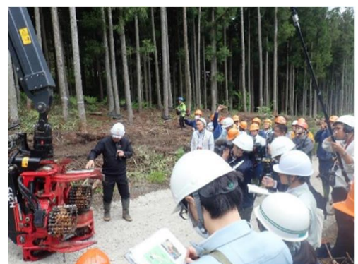
技術交流会 R7.5.27 桐生市黒保根町赤面国有林 「デジタル林業のフル活用で林業イノベーション」