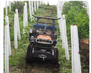
遠隔操作式下刈機械の普及 （吾妻森林管理署）

※成長が早く下刈回数の削減が期待されるほか、少花粉であり花粉症対策の効果も期待される