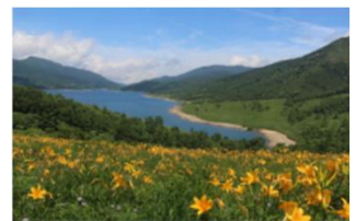
野反自然休養林(中之条町)

野反湖周辺の国有林は、自然景観が美しく、保健休養やレクリエーションの場として、広く国民の皆さんに利用していただくため、自然休養林に設定しています(「日本美しい森 お薦め国有林」にも選定されています。)。吾妻森林管理署では、地元の六合中学校や地域住民、関係機関から構成される野反自然休養林保護管理運営協議会と共同で、遊歩道整備及び湖畔周辺の植生保全活動を行っており、令和8年度においても継続して取り組みます。