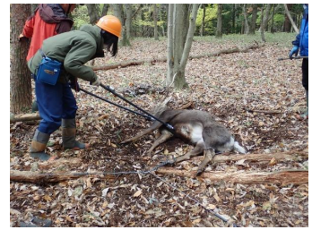
職員によるシカの捕獲（渋川市）

※小林式誘引捕獲：職員が開発した改良型わな。くくりわなの周囲に石やシカを誘引するための餌をドーナツ状に設置し、前足がわなにかかりやすくする工夫を施したもの（2023年3月人事院総裁賞受賞）