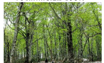
多様な活動の森(森の博物館玉原)(沼田市)