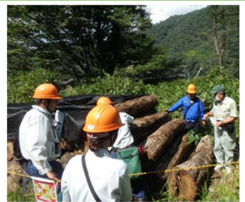
おとり丸太法(みなかみ町)

(被害本数 R5年度：526本、R6年度：6,965本、R7年度：6,602本)