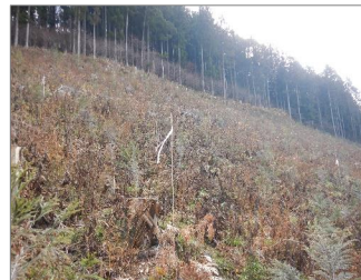
特定苗木 植栽後2年目の様子 川場村（利根沼田森林管理署）

また、低密度植栽や下刈回数の削減、初期成長に優れた特定苗木の導入（令和6年度 23,500本、令和7年度 25,200本、令和8年度 10,000本）等、林業の低コスト化・省力化に向けた技術を積極的に導入します。