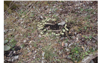
小林式くくりわな設置状況（イメージ）