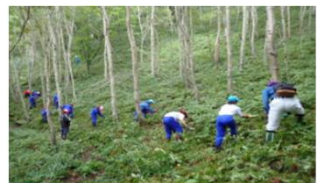
六合中学校の生徒による植生保全活動