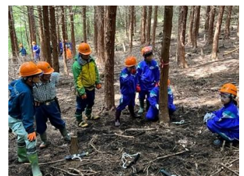
中学校森林体験活動(高崎市)

(令和8年度：ふれあいの森6箇所、社会貢献の森7箇所、遊々の森4箇所、多様な活動の森2箇所)