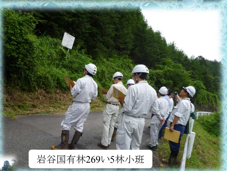
岩谷国有林269い5林小班