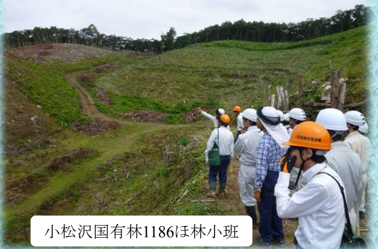
小松沢国有林1186ほ林小班

今後の低コスト化に向けて、エリートツリーの開発は重要課題であり、研修に参加された職員の皆さんは当センター職員の説明に聞き入っていました。