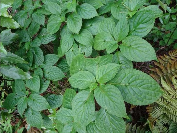
鋸歯先は芒状（のぎじょう）に突き出る