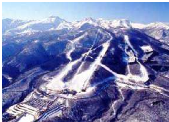
那須岳とスキー場全景