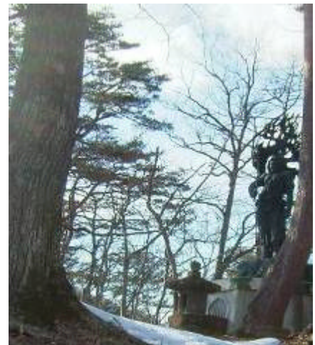
須巻富士山頂付近

この地区は、塩原温泉塩釜の南方に位置する標高 680m の山岳地帯である。大部分がアカマツ、クリ、コナラ、カエデ等の天然林で、この原生林的な自然景観と、通称須巻富士といわれる山頂部から塩原温泉街等を見下ろす素晴らしい眺望など、優れた自然景観を有している。