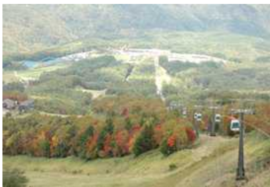
ゴンドラ山頂駅舎からの眺め