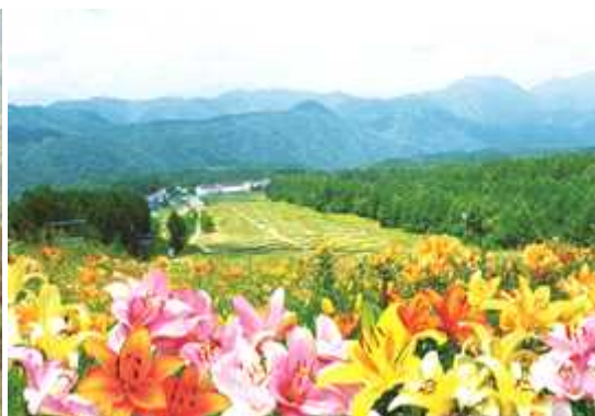
夏のゲレンデ（ゆりパーク）