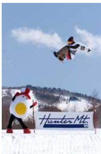
ハンタマくん (公式キャラ)