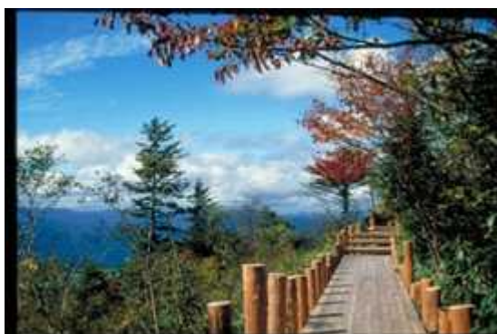
山頂駅舎周辺の遊歩道