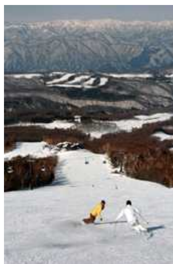
シーズン中のゲレンデ