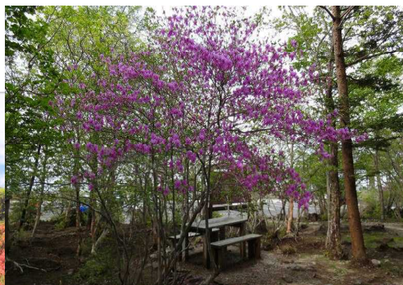
園地で咲くトウゴクミツバツツジ