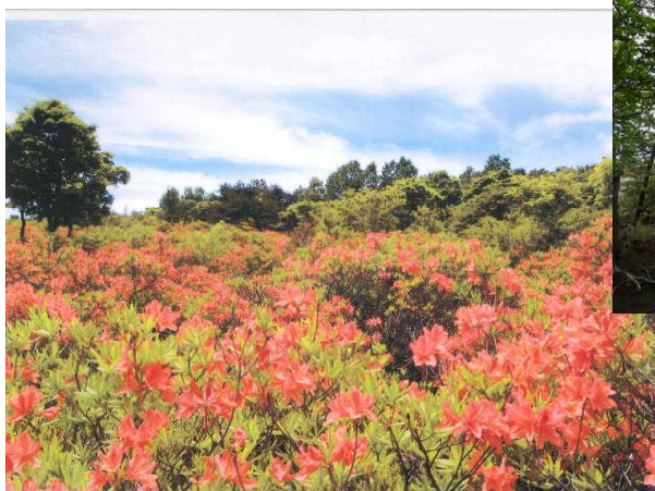
レンゲツツジ群生地