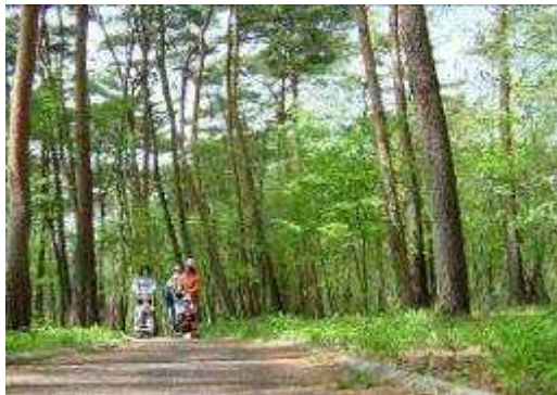
県道沿いのウッドチップ遊歩道