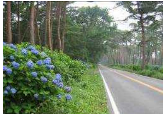
アカマツとアジサイ