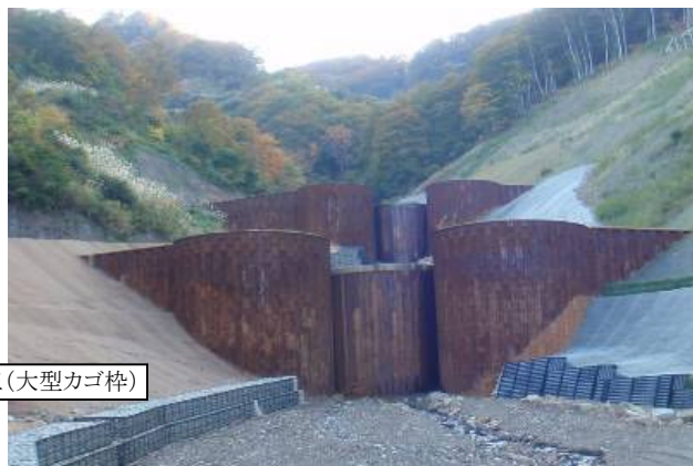
護岸工(大型カゴ枠)