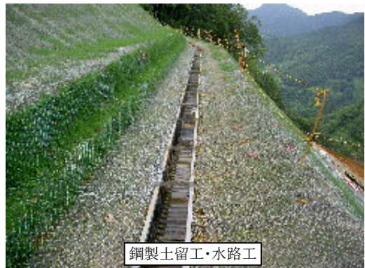
鋼製土留工・水路工