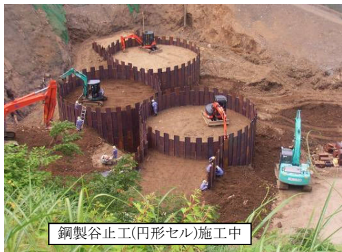
鋼製谷止工(円形セル)施工中