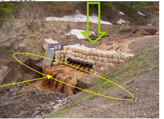
大型土のう堰堤設置:平成18年4月27日(増強5月12日)

清津峡温泉上流で土砂崩れ 大規模のため仮設堰堤工事に着手 十日町市では、大松沢川上流の崩壊斜面に、大量の土砂と残雪が不安定な状態で残存しており、融雪と相まって濁水がたびたび発生し、降雨等による土石流が懸念されたため、緊急に仮設堰堤を設置し、下流への土砂の流出を抑制する対策を講じた。また、崩壊斜面の土砂の流出を抑制するため、堰堤の設置に着手した。また、崩壊斜面の土砂の流出を抑制するため、堰堤の設置に着手した。また、崩壊斜面の土砂の流出を抑制するため、堰堤の設置に着手した。