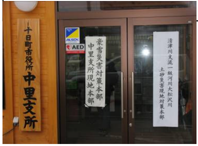
対策本部設置(平成18年4月24日)