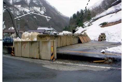
応急導流壁設置(新潟県施工)平成18年4月21日