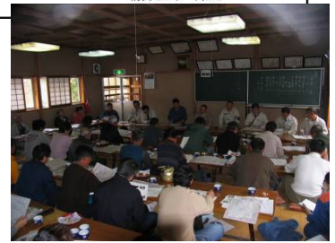
説明会(平成18年4月23日)