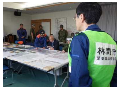
復興大臣への説明