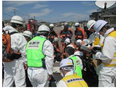
現地出発に向けて打合せ