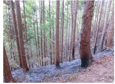
アカマツ人工林の被害の状況