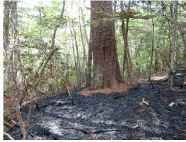
尾根における被害の状況