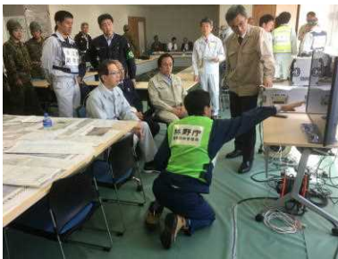
知事への延焼状況の説明