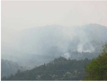
登山道入り口付近からの状況 (5/1)