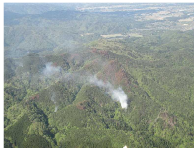
へりから南斜面の煙を確認 (5/4)