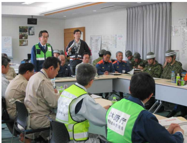
現地対策本部会議